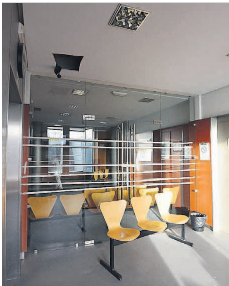
El acceso a la tercera planta está bloqueado. // Gustavo Santos

Desde primera hora, operarios de rehabilitación de estructuras, con la coordinación de técnicos de Mantenimiento de esta área sanitaria —que han delimitado y señalado la zona— supervisaron los trabajos que se realizan en dicha sala de espera, que se prevé quede rehabilitada y operativa para el inicio de la próxima semana. Comenzaron por la retirada del material que se vino abajo del falso techo. Afortunadamente, no había usuarios en el centro de salud cuando este material se desprendió.