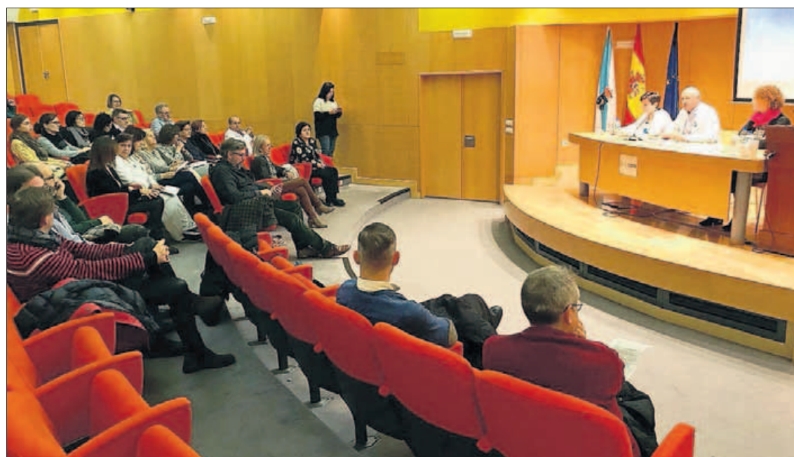
La jornada se celebró en el salón de actos del Hospital Montecelo.

El cuerpo cayó sobre un tejadillo del centro sanitario. Al lugar acudió una comisión judicial para proceder al levantamiento del cadáver.