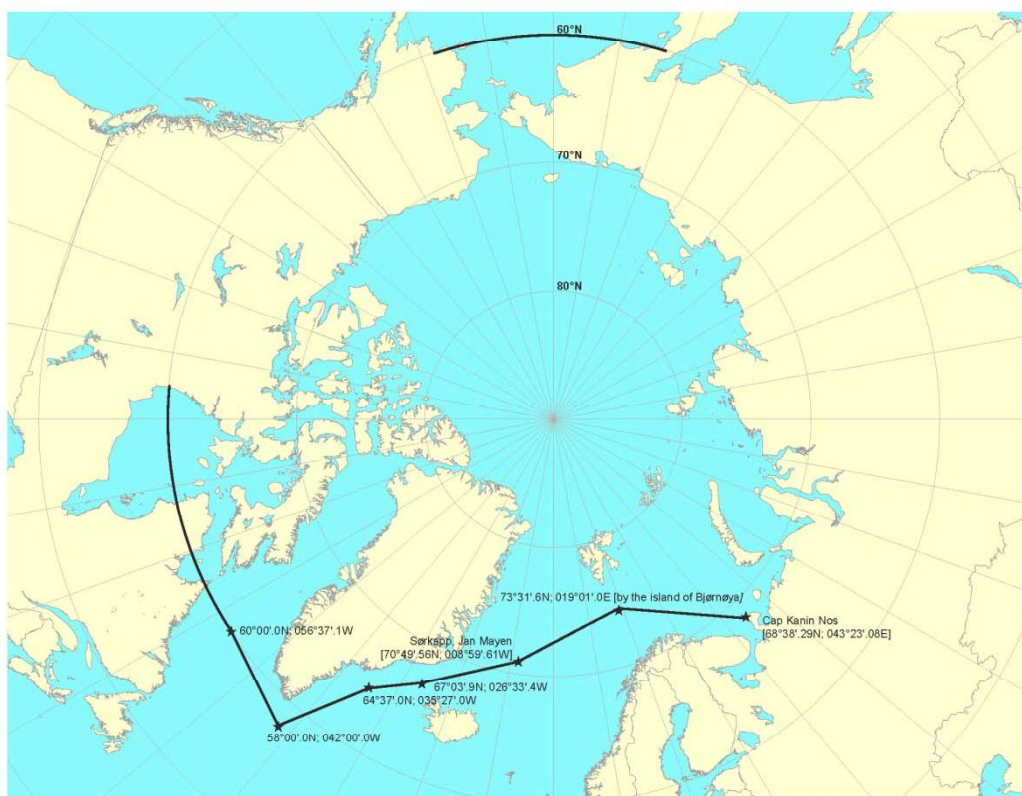
Figura 2: Extensión máxima del ámbito de aplicación en aguas árticas 3