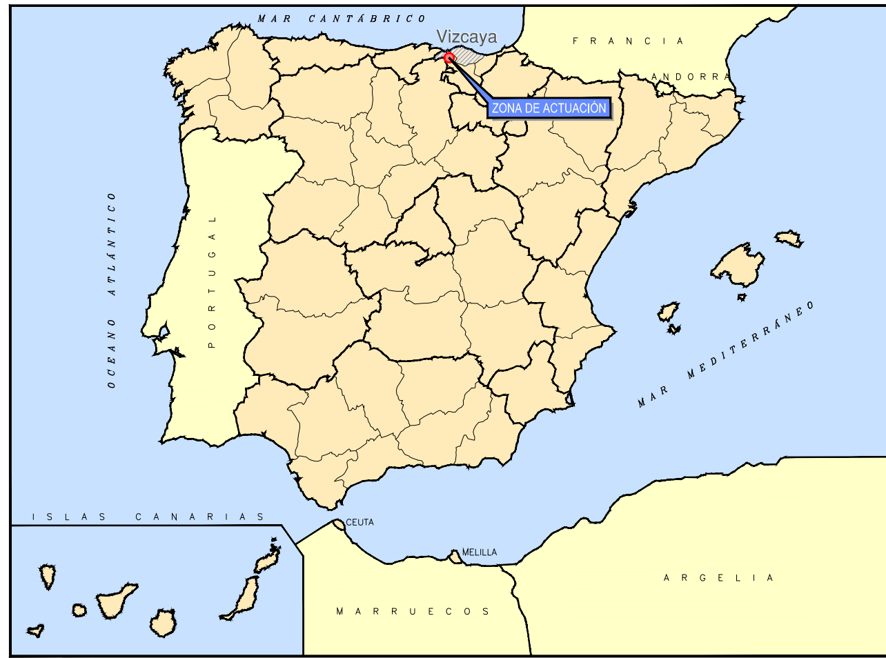
SITUACIÓN GEOGRÁFICA SIN ESCALA