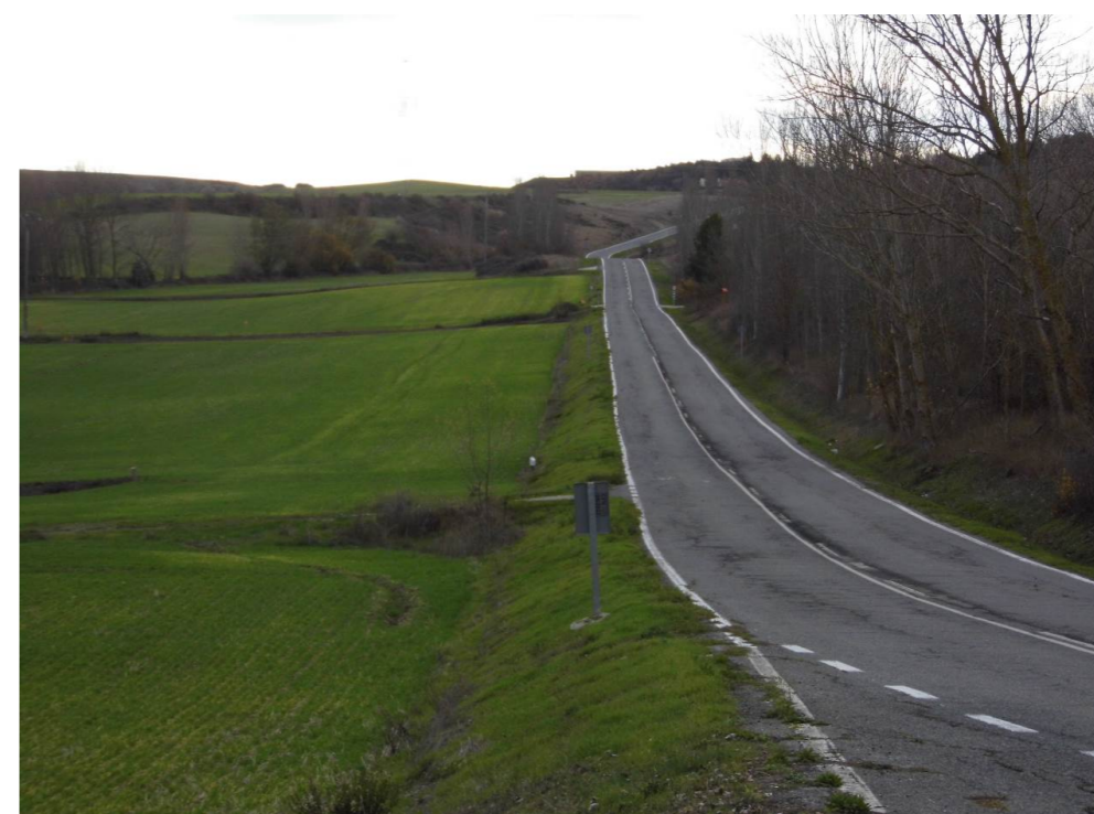
Fotografía 84. Carretera NA-6009, al suroeste de la localidad de Beriáin. Carretera atravesada por las alternativas de tipo 2 y de tipo 3.