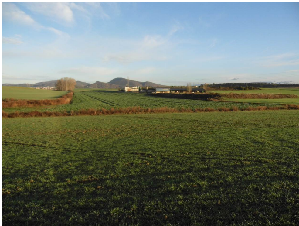
Fotografía 13. Explotación agropecuaria al sur del municipio de Iza.