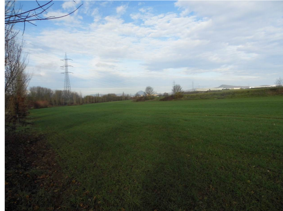
Fotografía 31 Parque Fluvial de la Comarca de Pamplona. Margen derecha del río Arga, en Cendea de Olza, a la altura de la Factoría Volkswagen. Cultivos. Zona de viaducto ferroviario proyectado.