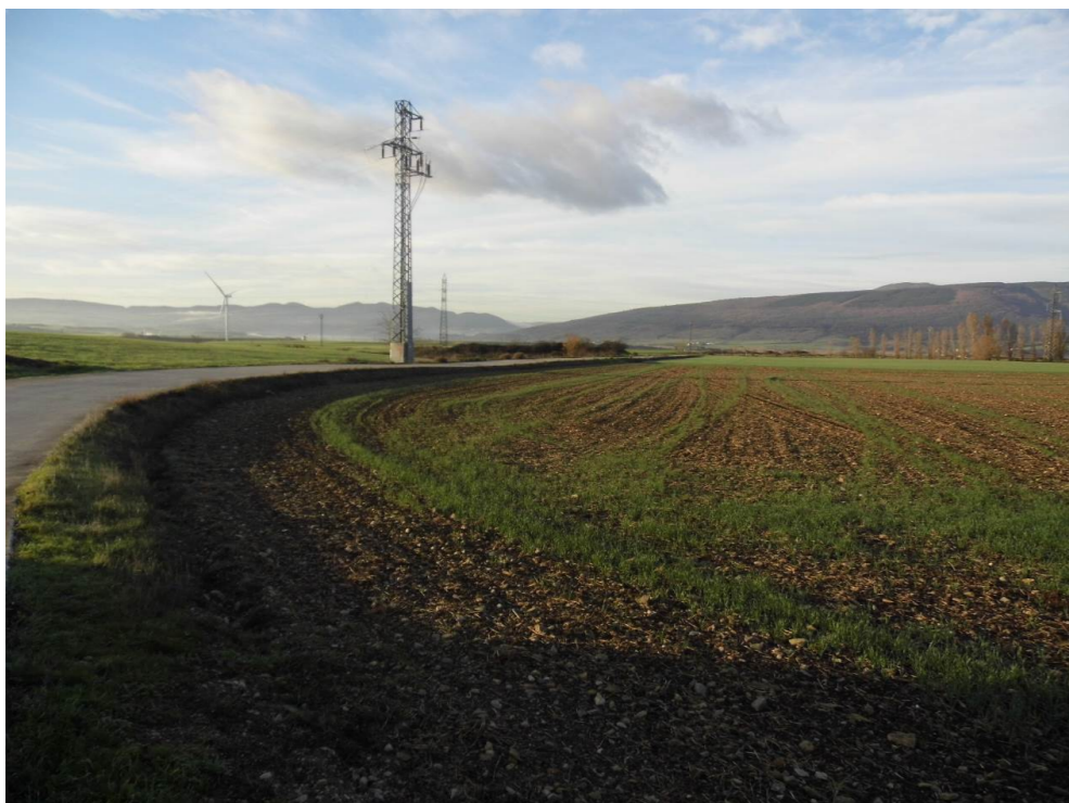
Fotografía 5. Campos al sur de la localidad de Zuasti.