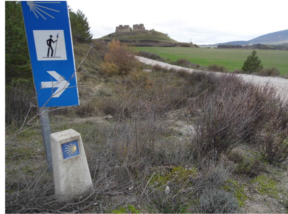
Fotografía 92. Castillo de Tiebas, desde carretera de acceso a las canteras de Alaiz.