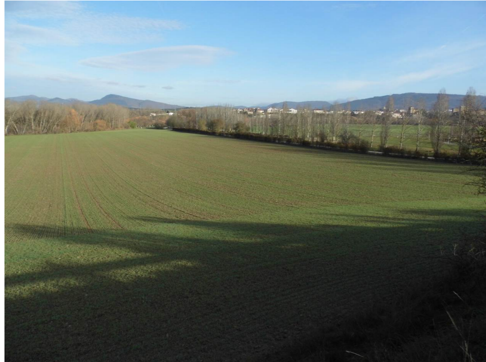
Fotografía 25. Vega del río Arga junto a la EDAR Arazuri. Municipio de Cendea de Olza. Zona atravesada por el trazado de la infraestructura ferroviaria.