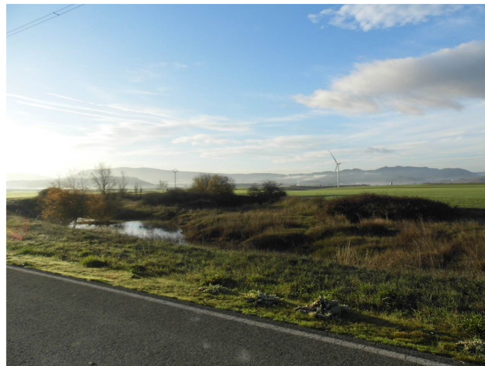
Fotografía 8. Pastizales húmedos al sur de la localidad de Zuasti, al este del trazado de la infraestructura ferroviaria.