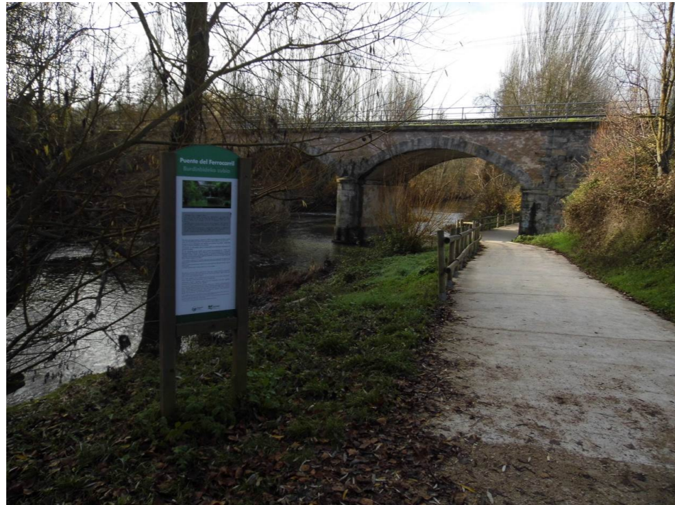
Fotografía 33. Parque Fluvial de la Comarca de Pamplona. Cruce del ferrocarril con el río Arga. Límite de los municipios de Cendea de Olza y Barañáin. Zona de viaducto ferroviario proyectado.