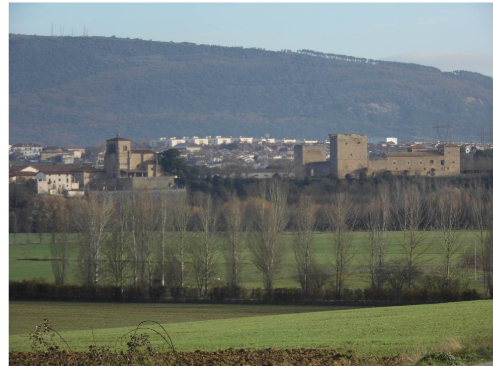
Fotografía 28. Localidad de Arazuri. Iglesia parroquial y castillo.