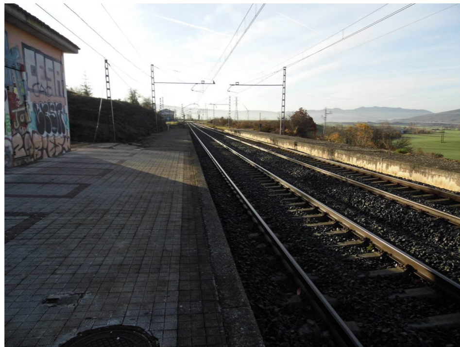
Fotografía 2. Estación de ferrocarril de Zuasti.