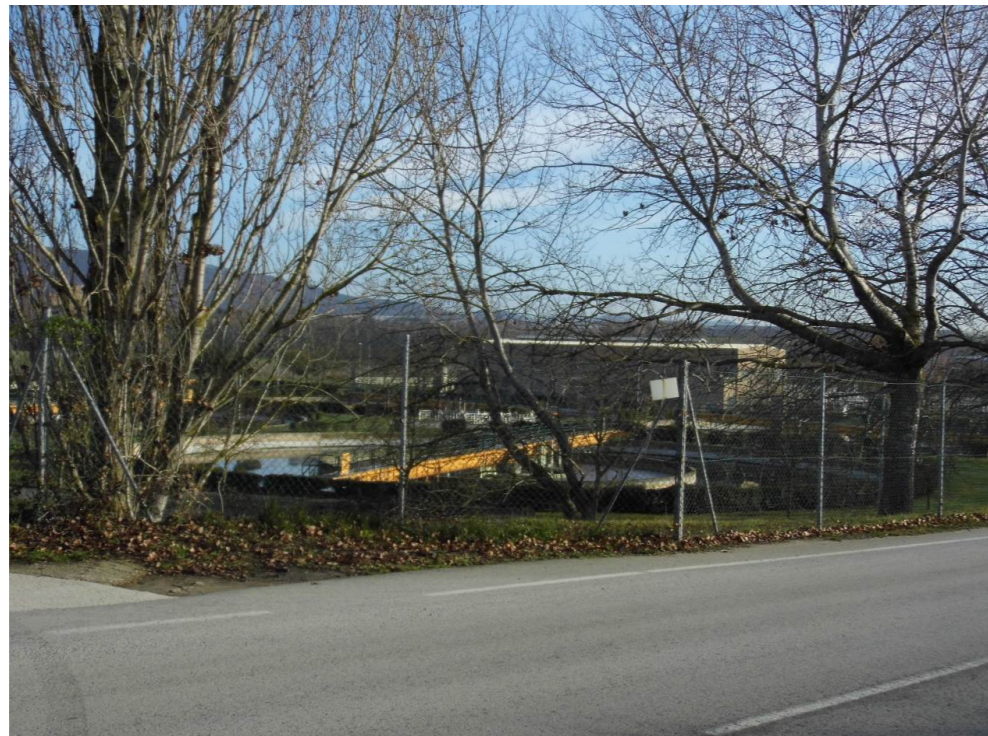
Fotografía 26. EDAR Arazuri. Municipio de Cendea de Olza.