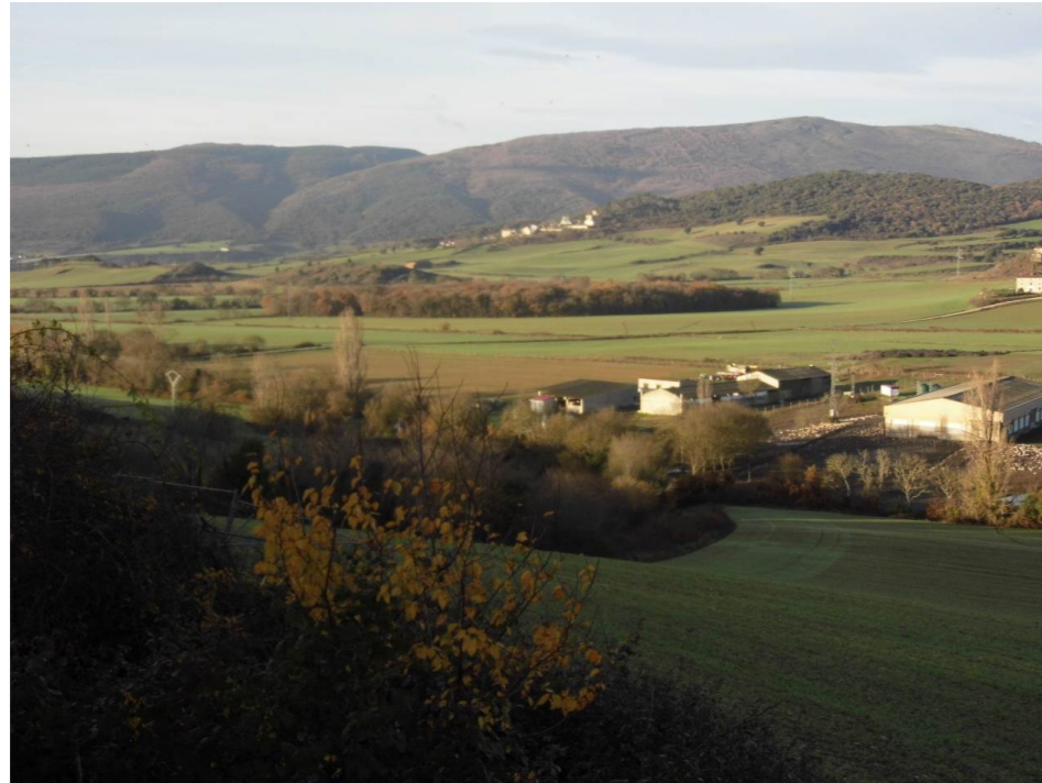
Fotografía 1. Desde la localidad de Aldaba. Terrenos y explotaciones al oeste de la localidad. Barranco de Aldaba