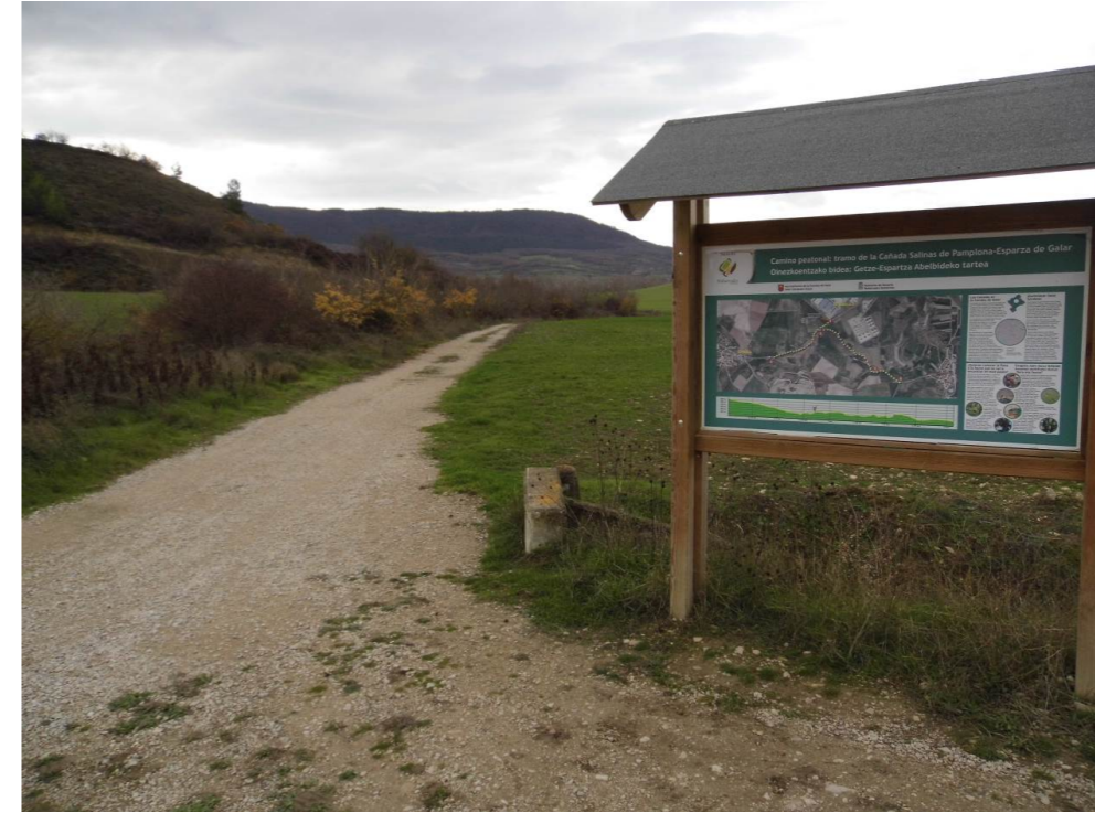
Fotografía 63. Barranco Recazar. Camino peatonal señalizado. Tramo de la Cañada Salinas de Pamplona-Esparza de Galar. Zona atravesada por el trazado de las alternativas de tipo 3.