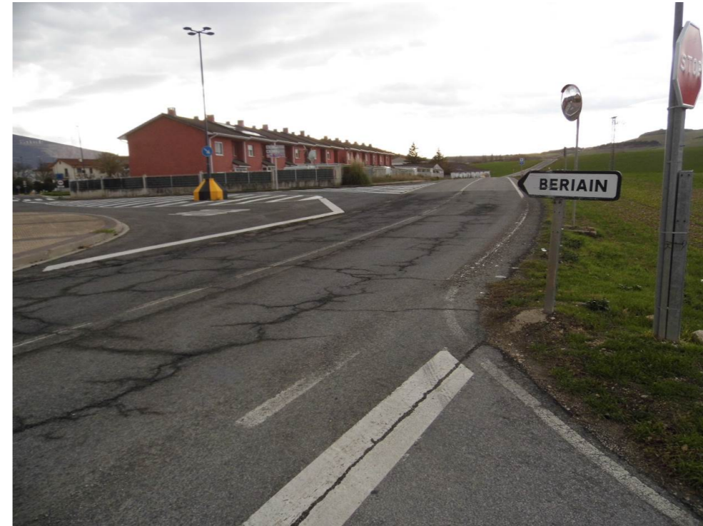
Fotografía 75. Acceso a la localidad de Beriáin, en el cruce de las carreteras NA-6007 y NA-6009.