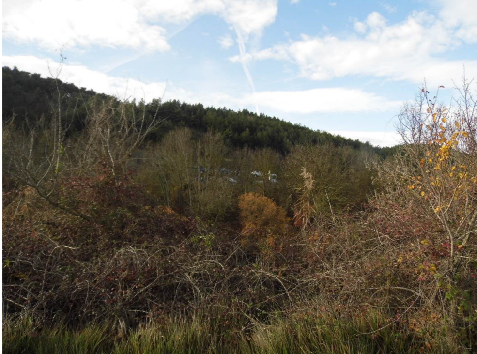
Fotografía 30 Laderas de pinar en el límite de los municipios de Cendea de Olza y Cizur Mayor, al sureste de la EDAR Arazuri. Monte Gazólaz. Zona de desmontes y viaducto del trazado de la infraestructura ferroviaria.