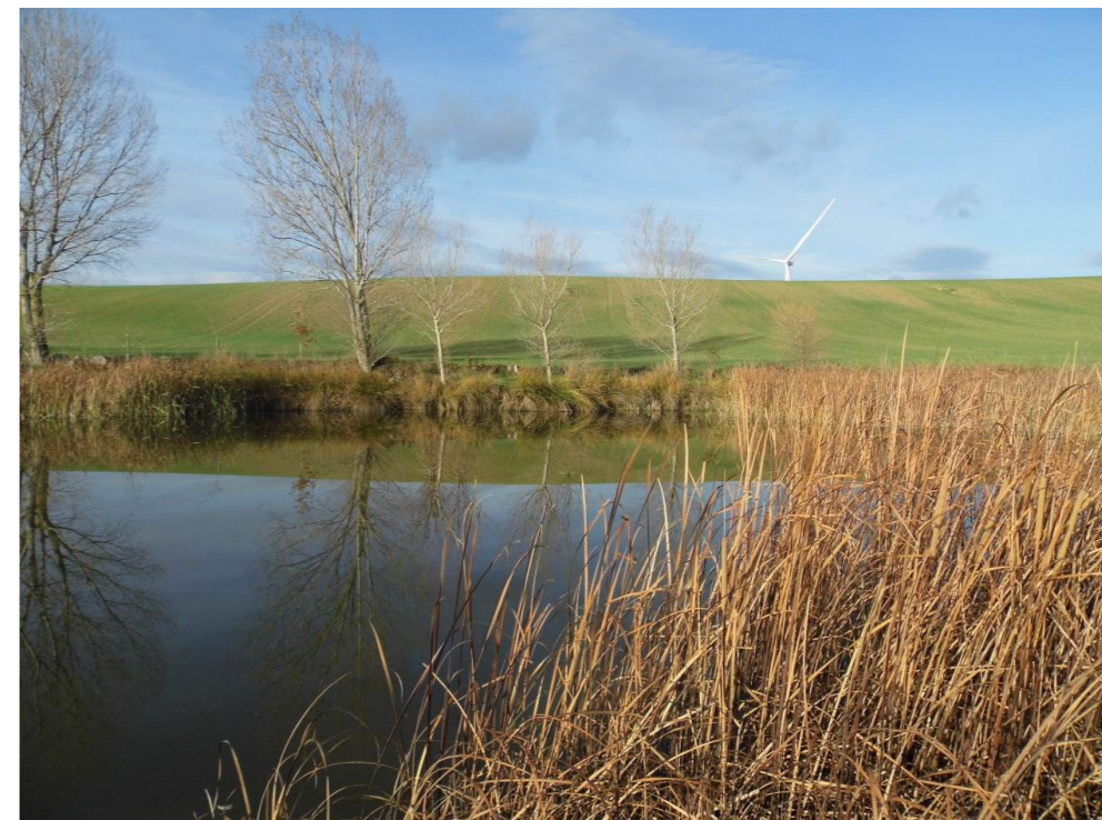
Fotografía 20. Balsa Ollatibar. Al fondo, parque eólico "Orkoien".