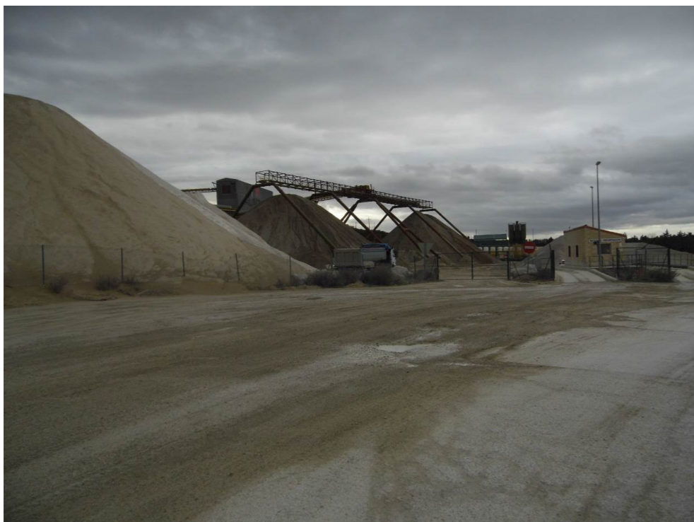
Fotografía 93. Canteras de Alaiz. Municipio de Tiebas-Muruarte de Reta.