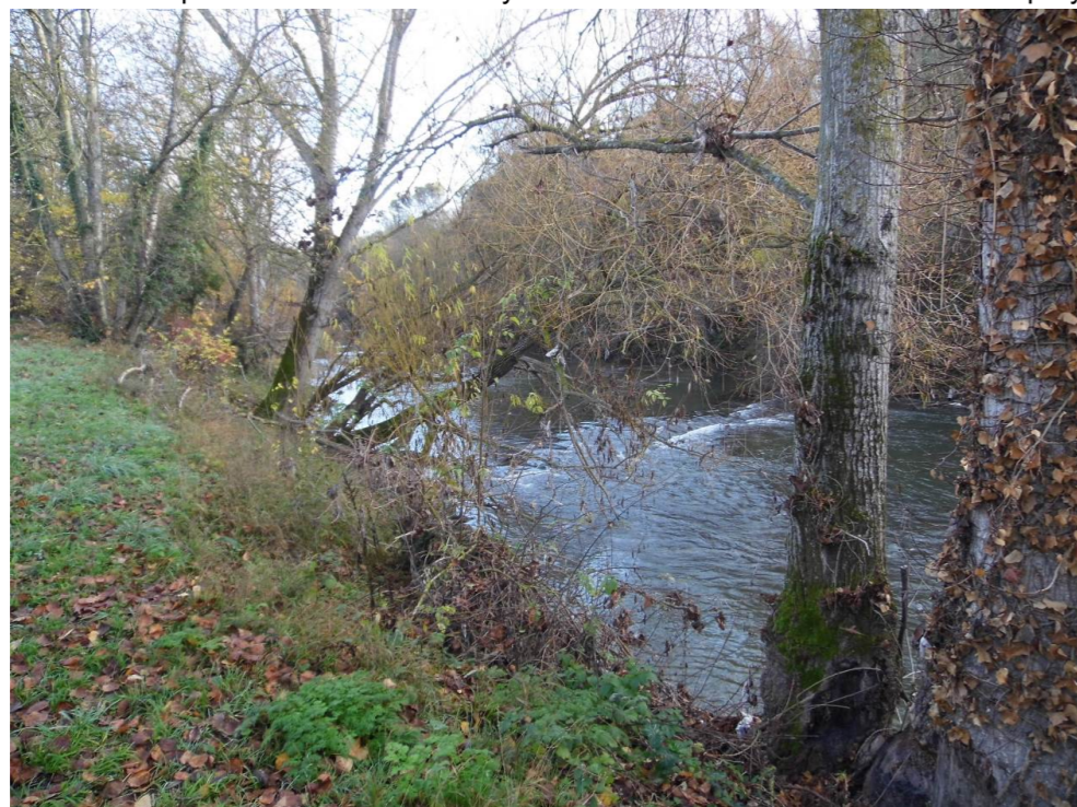
Fotografía 34 Parque Fluvial de la Comarca de Pamplona. Río Arga en el límite de los municipios de Cendea de Olza y Barañáin. Zona de viaducto ferroviario proyectado.