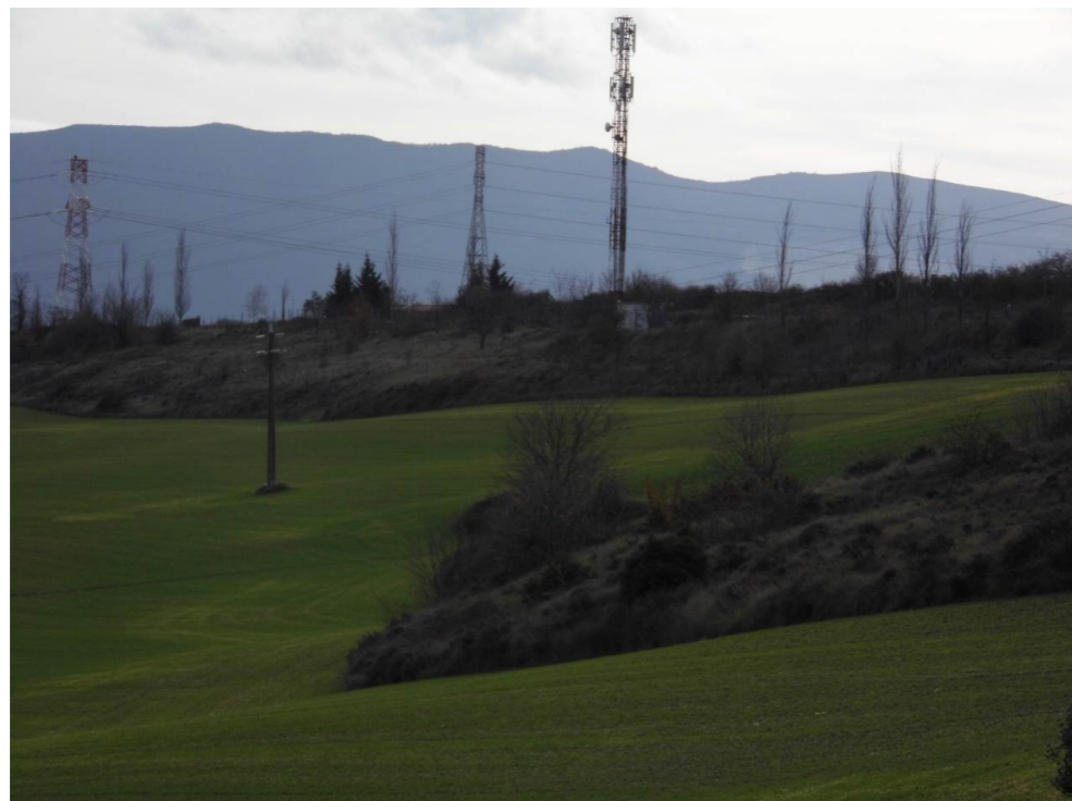
Fotografía 50 Laderas arboladas, junto al camino de Esquiroz, al sureste de la localidad de Cizur Menor. Término municipal de Cizur. Zona atravesada por el trazado de las alternativas de tipo 3.