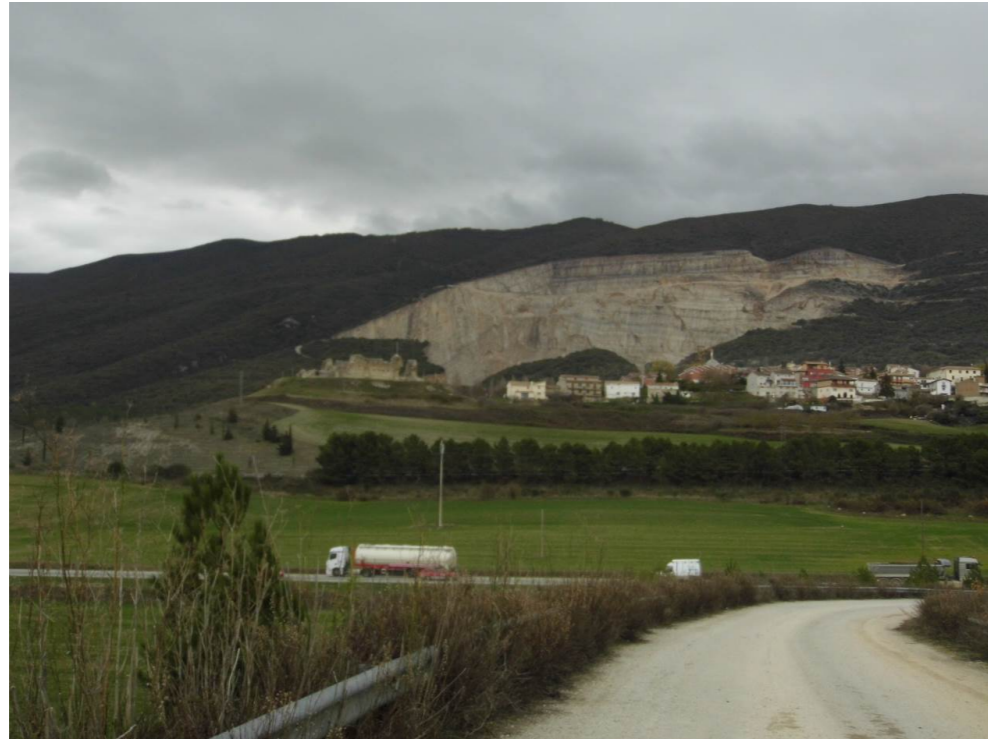
Fotografía 89. Canteras situadas por detrás de la localidad de Tiebas. Sierra de Alaiz.