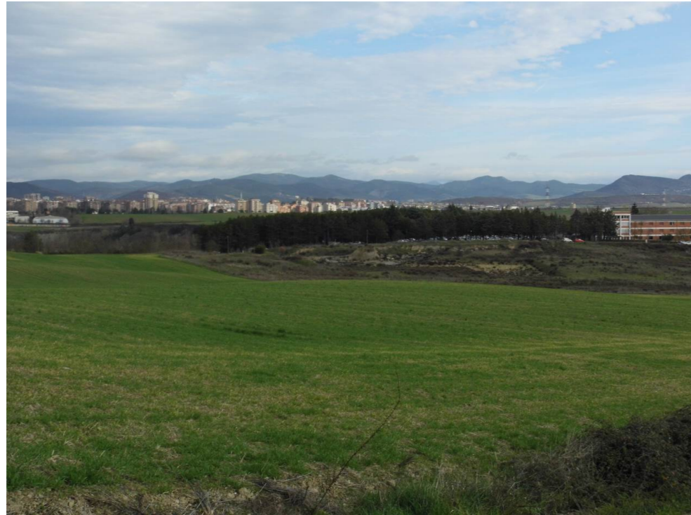
Fotografía 49. Entorno de la San Fermín Ikastola, desde el entorno de Cizur Menor. Terrenos afectados por las alternativas de tipo 3.