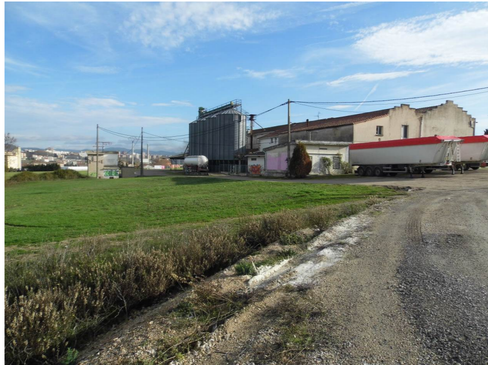
Fotografía 41. Naves y almacenes en la avenida de Aróstegui, en el municipio de Zizur Mayor, aldeaña a las cuales se localiza la nueva estación de Pamplona.