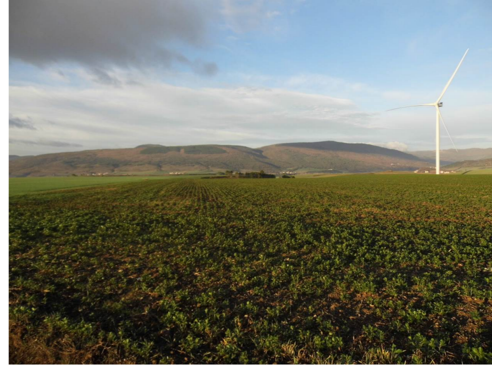
Fotografía 11. Terrenos afectados por el trazado de la infraestructura ferroviaria. Aerogenerador del parque eólico "Orkoien", en el municipio de Cendea de Olza.