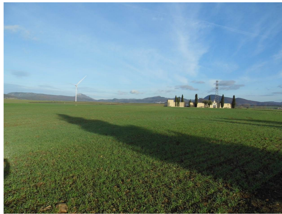
Fotografía 15. Al fondo, parque eólico "Orkoien". Cementerio de Ororbía.