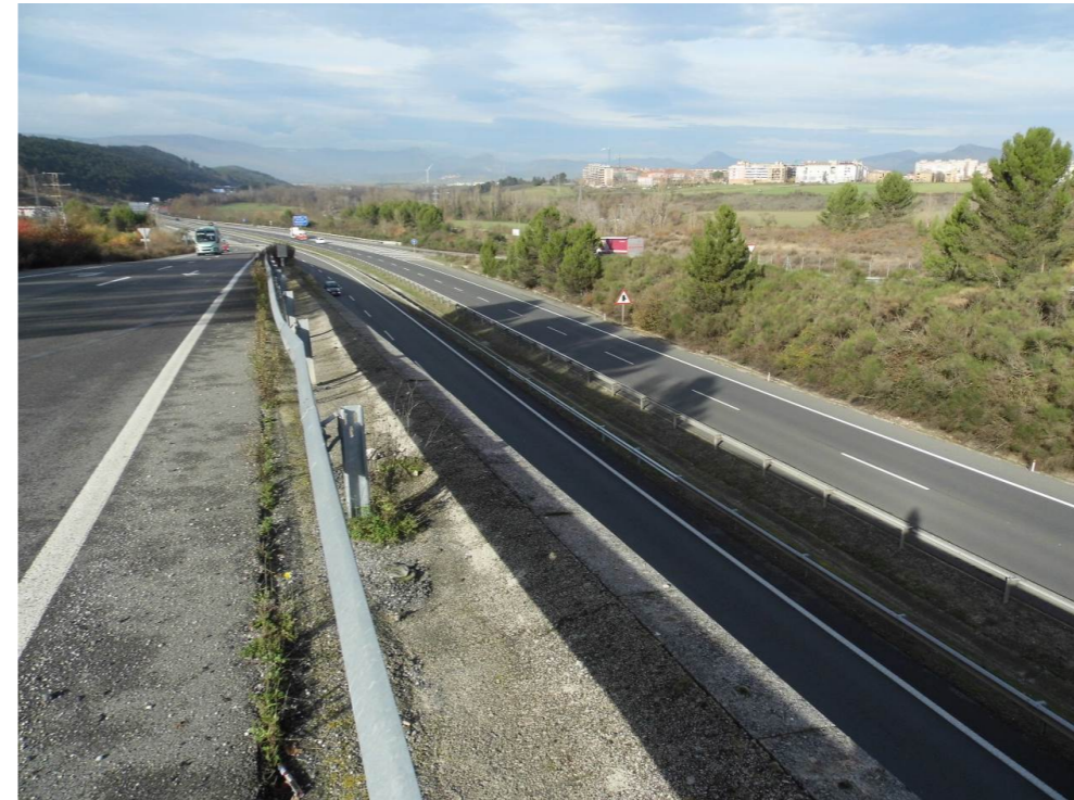
Fotografía 39. Autovía A-15, desde el paso superior de la NA-30. Zona de viaducto ferroviario proyectado.