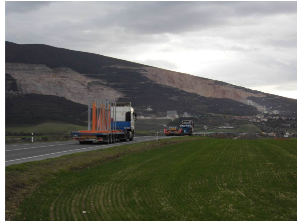
Fotografía 91. Canteras de la Sierra de Alaiz. Carretera N-121.