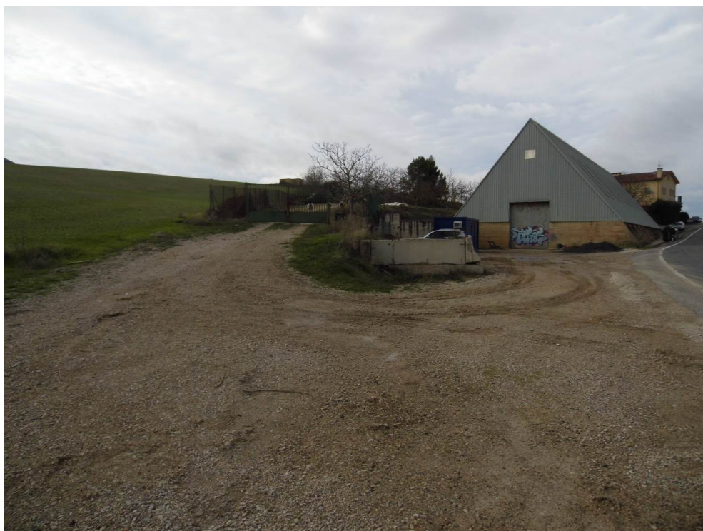
Fotografía 78. Construcciones del asador El Pozo de Beriáin, en la carretera NA-6007. Zona atravesada por el trazado de las alternativas de tipo 3.