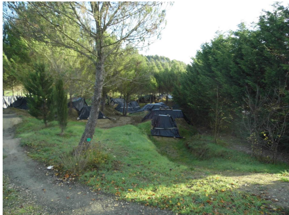
Fotografía 18. Benito Urdanoz Bike Park, en la senda de la balsa Ollatibar.