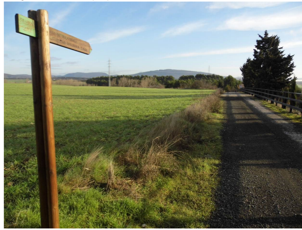
Fotografía 16. Camino correspondiente a la senda que se dirige a la balsa Ollatibar.