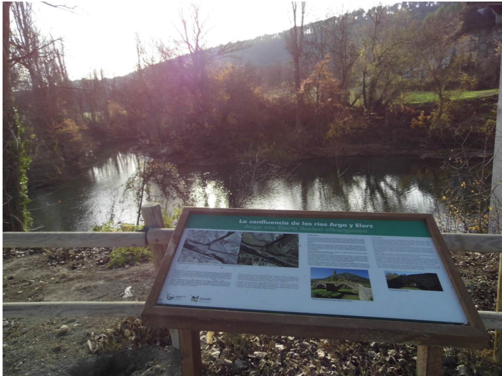
Fotografía 37. Parque Fluvial de la Comarca de Pamplona. Confluencia de los ríos Arga y Elorz. Zona de viaducto ferroviario proyectado.