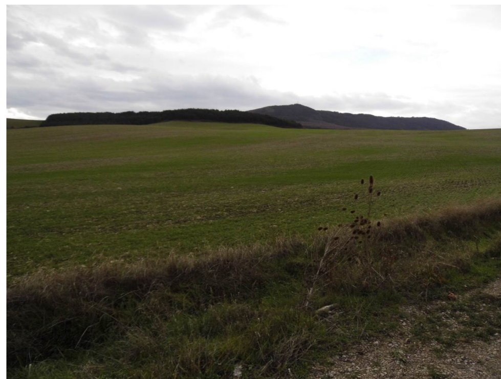
Fotografía 80. Campos junto a la carretera NA-6007, al oeste de Beriáin. Terrenos en el entorno de las alternativas de tipo 2 y de tipo 3.