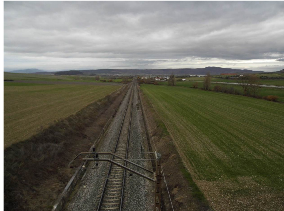
Fotografía 88. Vía ferroviaria. Desde paso superior situado al noroeste de la localidad de Tiebas. Vista hacia el norte. Municipio de Tiebas-Muruarte de Reta. Zona de inicio del trazado proyectado.