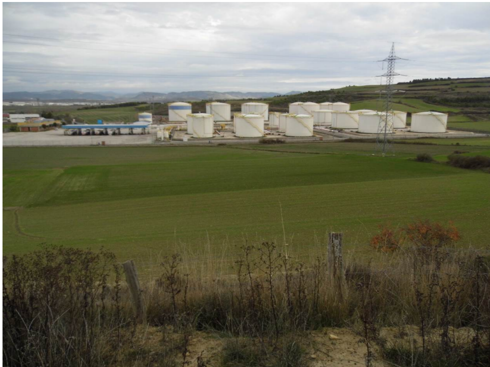
Fotografía 62. Depósitos de CLH, al sur del Polígono Comarca II, en el término municipal de Galar. Proximidades de la zona atravesada por el trazado de las alternativas de tipo 3.