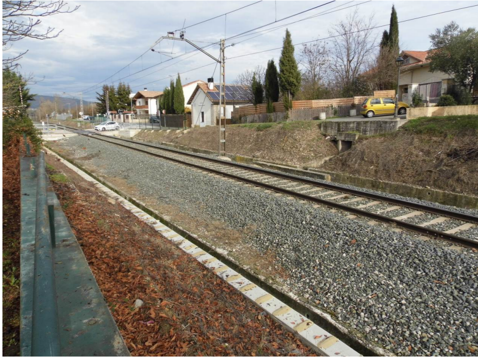
Fotografía 53. Vía ferroviaria en la localidad de Esquiroz.