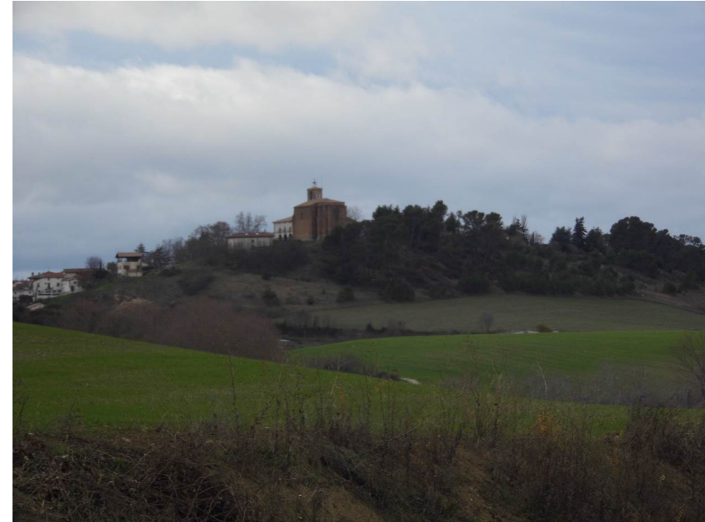
Fotografía 67. Localidad de Esparza.