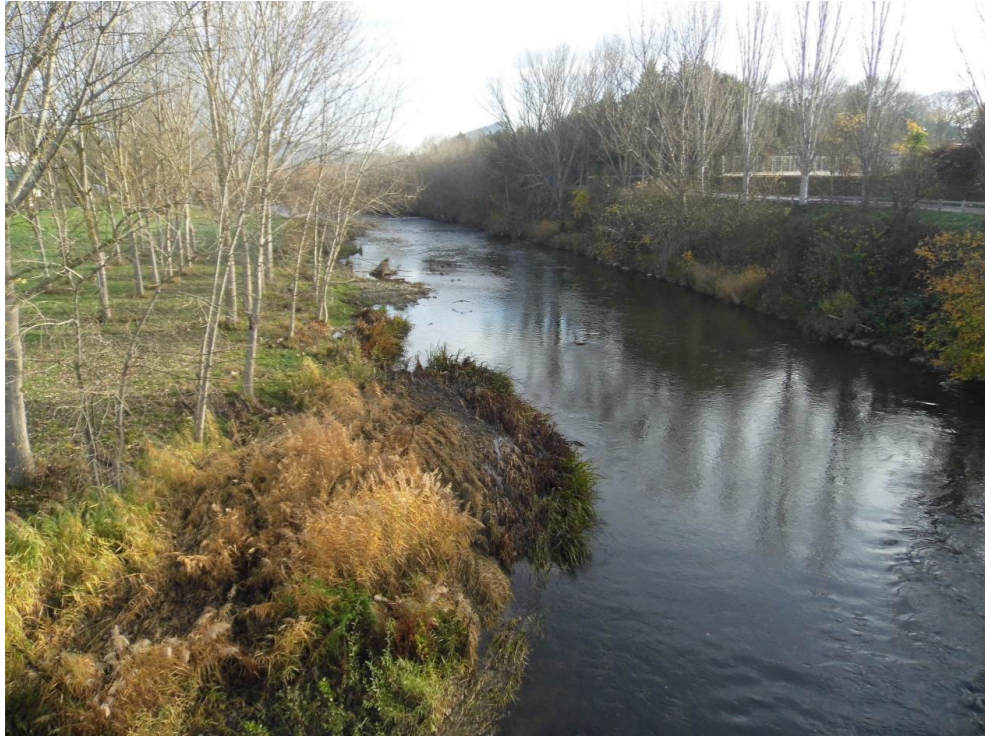
Fotografía 21. Río Arga en Ororbía.