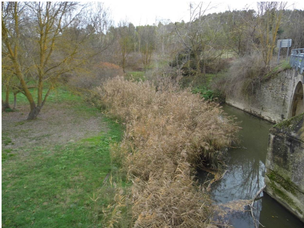
Fotografía 54. Puente de la carretera NA-6008 sobre el río Elorz, al sur de la localidad de Salinas de Pamplona. Para las alternativas de tipo 2 se proyecta un viaducto próximo.