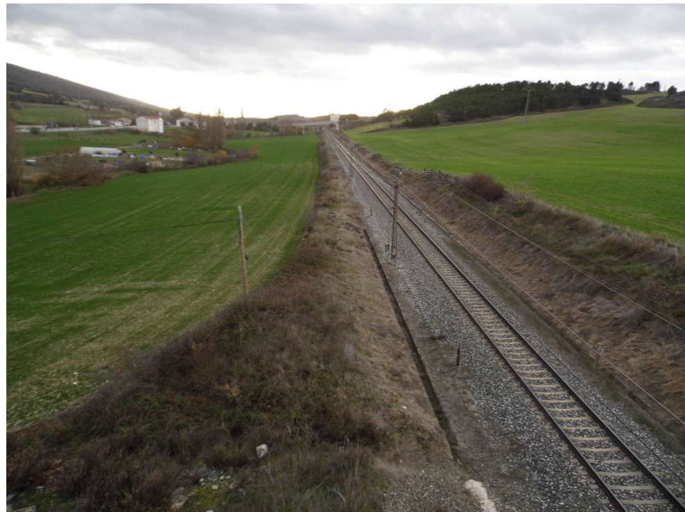
Fotografía 90. Vía ferroviaria. Desde paso superior situado al noroeste de la localidad de Tiebas. Vista hacia el sur. Municipio de Tiebas-Muruarte de Reta. Zona de inicio del trazado proyectado.