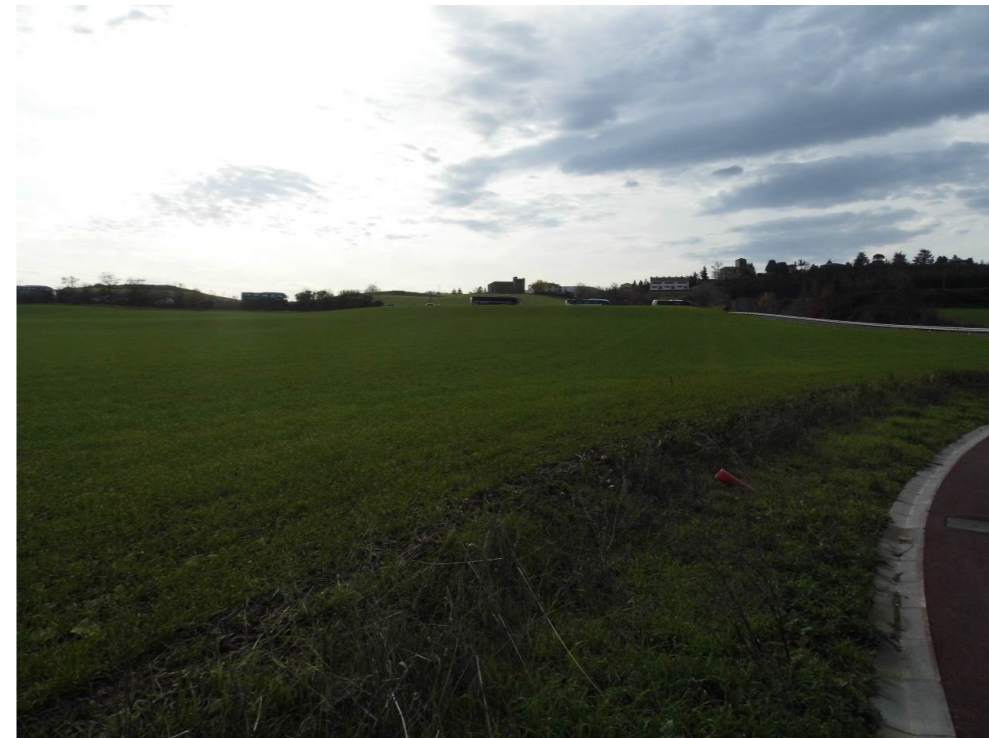
Fotografía 48. Campos de cultivo junto a la carretera NA-6000, al sur del Colegio Mayor Santa Clara. Terrenos afectados por los trazados analizados.