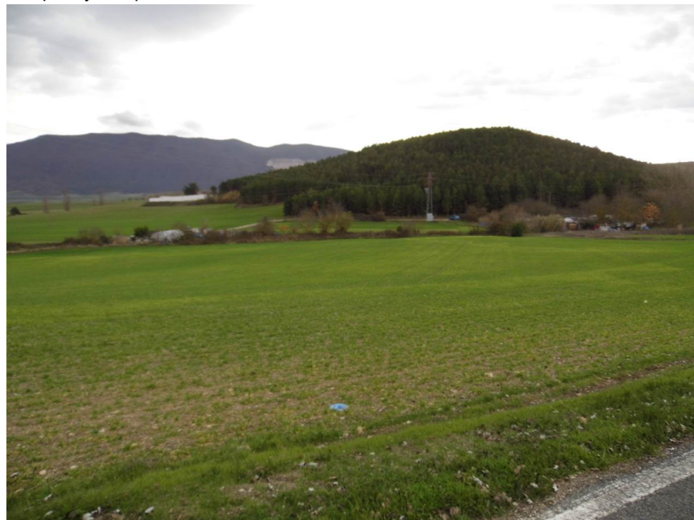
Fotografía 82. Desde la carretera NA-6009, elevación ocupada por pinares situada al suroeste de la localidad de Beriáin (Alto del Monte). Ladera atravesada por las alternativas de tipo 2.