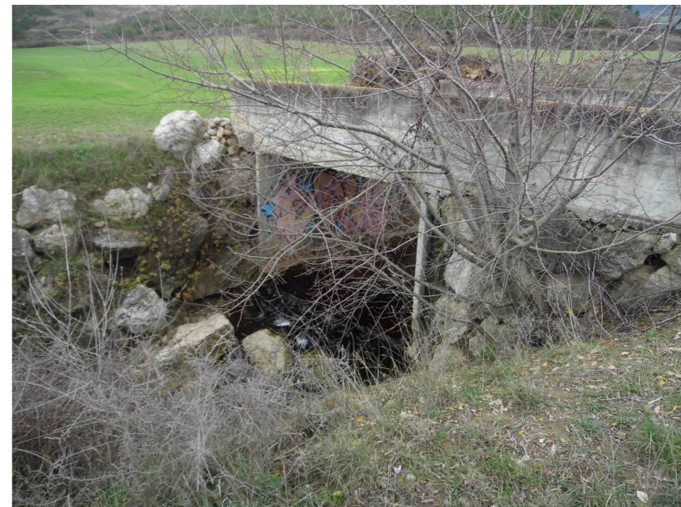
Fotografía 60. Puente peatonal en el barranco Recazar. Zona atravesada por el trazado de las alternativas de tipo 3.