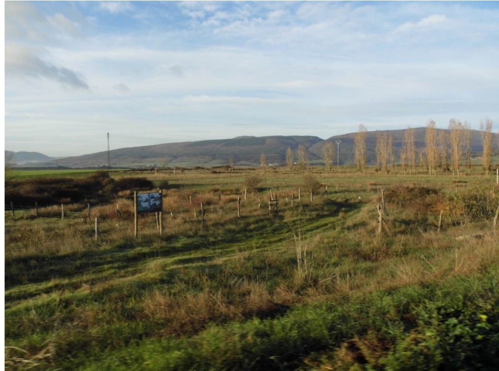
Fotografía 9. Pastizales húmedos y chopera al sur de la localidad de Zuasti, al este del trazado de la infraestructura ferroviaria.