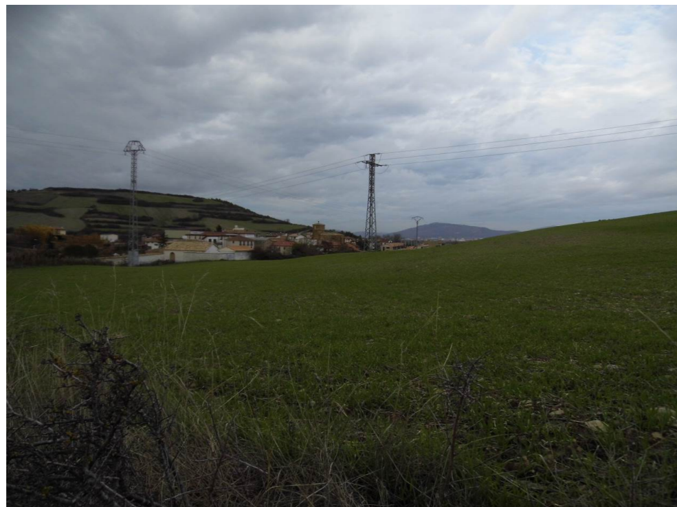
Fotografía 74. Campos al sureste de Salinas de Pamplona. Cementerio y núcleo. Proximidades de la zona atravesada por el trazado de las alternativas de tipo 2.