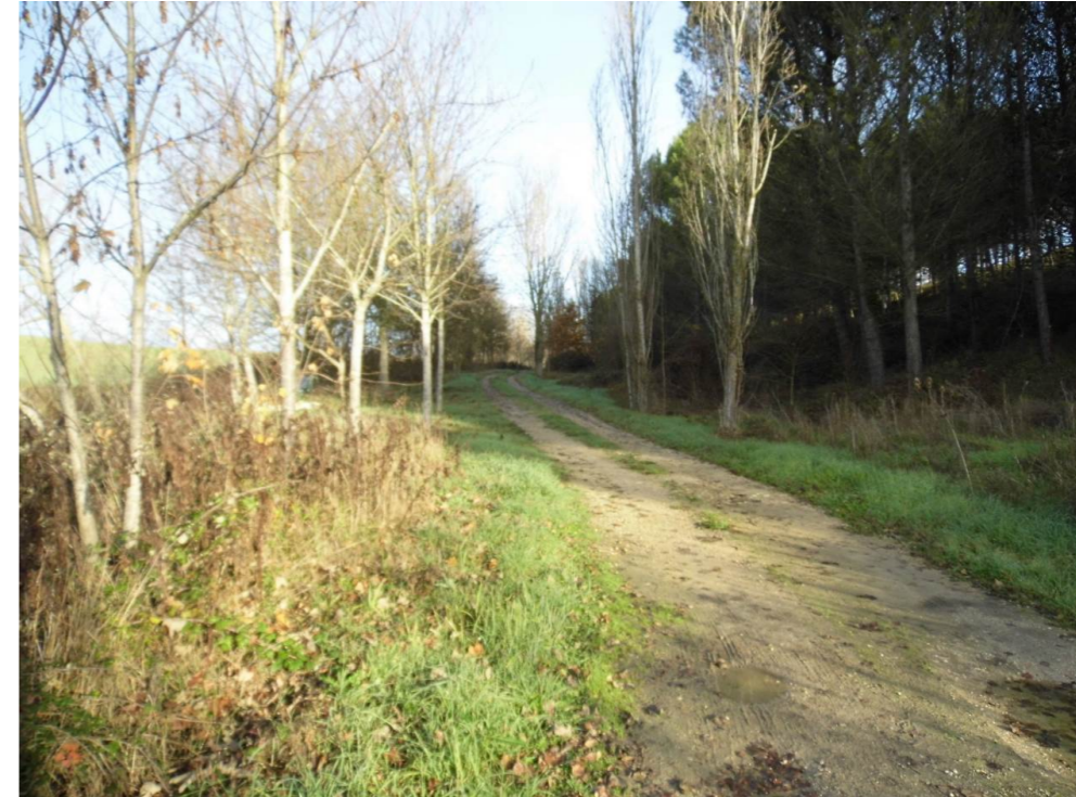
Fotografía 19. Senda de la balsa Ollatibar. Municipio de Cendea de Olza. Zona atravesada por el trazado de la infraestructura ferroviaria.