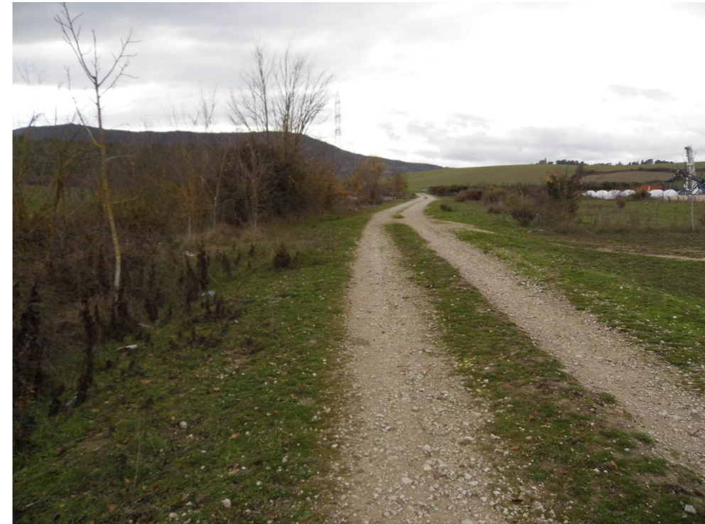
Fotografía 59. Camino en la margen izquierda del barranco Recazar, al suroeste del Polígono Comarca II de Galar. Zona atravesada por el trazado de las alternativas de tipo 3.