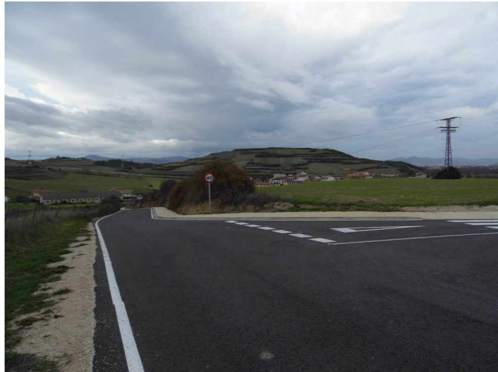
Fotografía 73. Vértice occidental del Polígono industrial Meseta de Salinas. Al fondo, localidad de Salinas de Pamplona. Proximidades de la zona atravesada por el trazado de las alternativas de tipo 2.