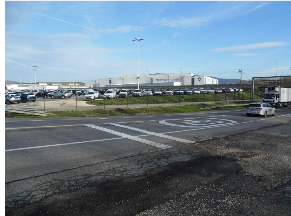
Fotografía 32 Factoría Volkswagen, en el extremo suroriental del municipio de Cendea de Olza.