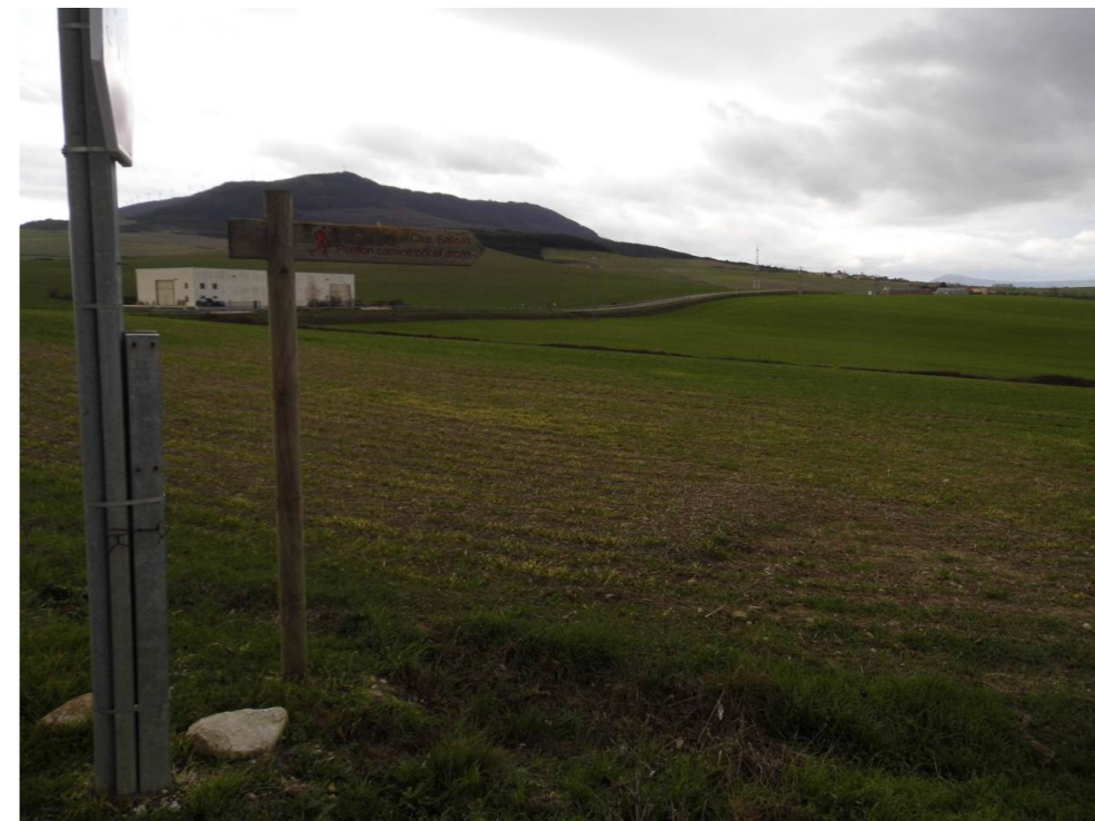
Fotografía 76. Cultivos y nave al noroeste de la localidad de Beriáin. Zona atravesada por el trazado de las alternativas de tipo 2.