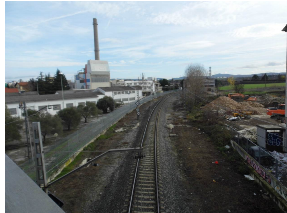
Fotografía 43. Paso superior sobre el ferrocarril en la avenida de Aróstegui. Vista hacia el este. A la izquierda, instalaciones de la empresa Huntsman Advanced Material of Spain.