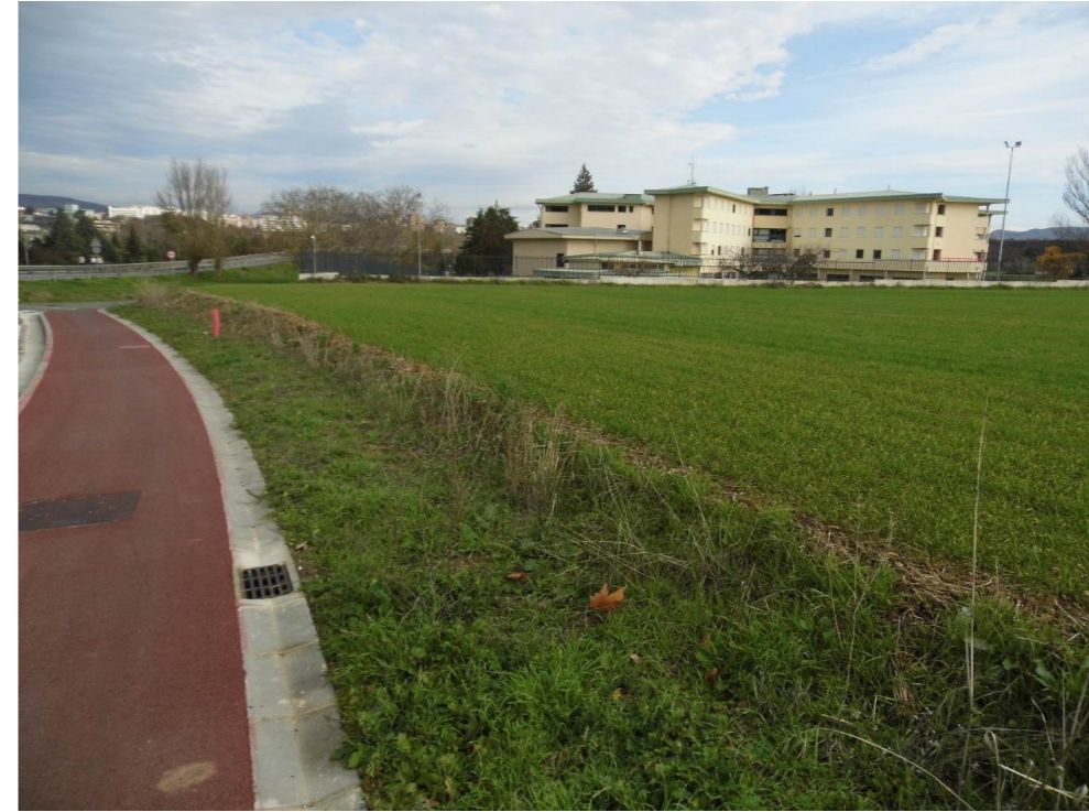
Fotografía 47. Colegio Mayor Santa Clara, muy próximo al trazado de la infraestructura ferroviaria.