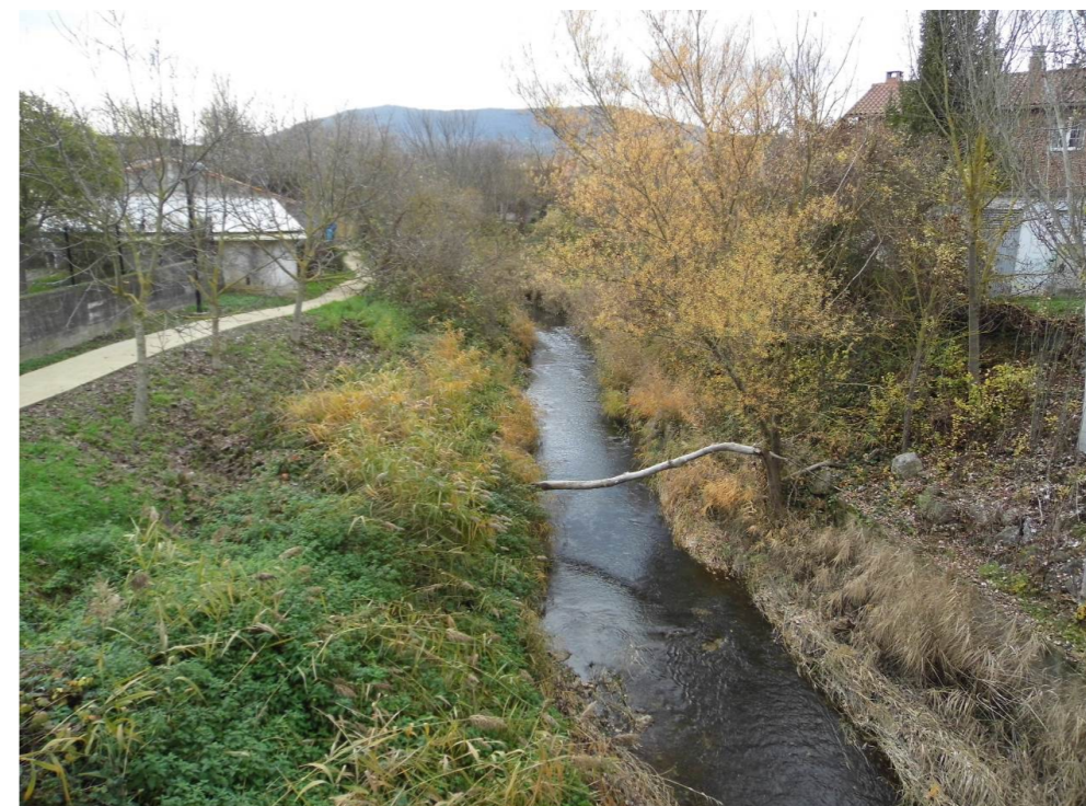
Fotografía 52. Río Elorz en la localidad de Esquiroz.