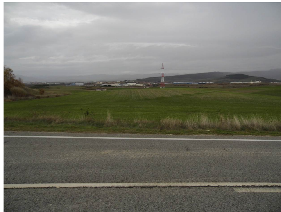
Fotografía 79. Campos junto a la carretera NA-6007, al norte de Beriáin.