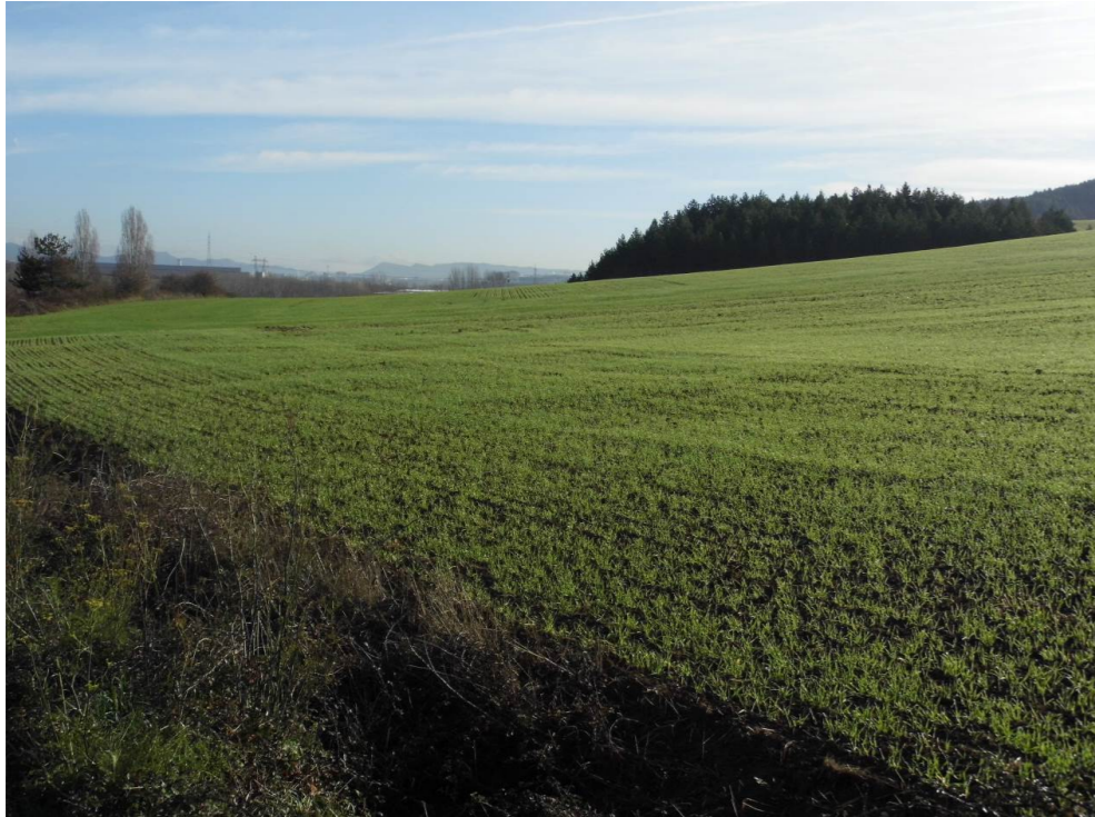
Fotografía 29. Pinares y cultivos situados al sur de la EDAR Arazuri. Monte Gazólaz.