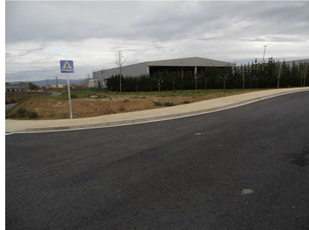
Fotografía 71. Polígono industrial Meseta de Salinas, en el límite de los municipios de Galar y Noáin. Proximidades de la zona atravesada por el trazado de las alternativas de tipo 2.