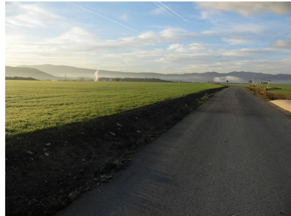
Fotografía 12. Camino de Iza, entre Aldaba y Ororbía en la zona atravesada por el trazado de la infraestructura ferroviaria.