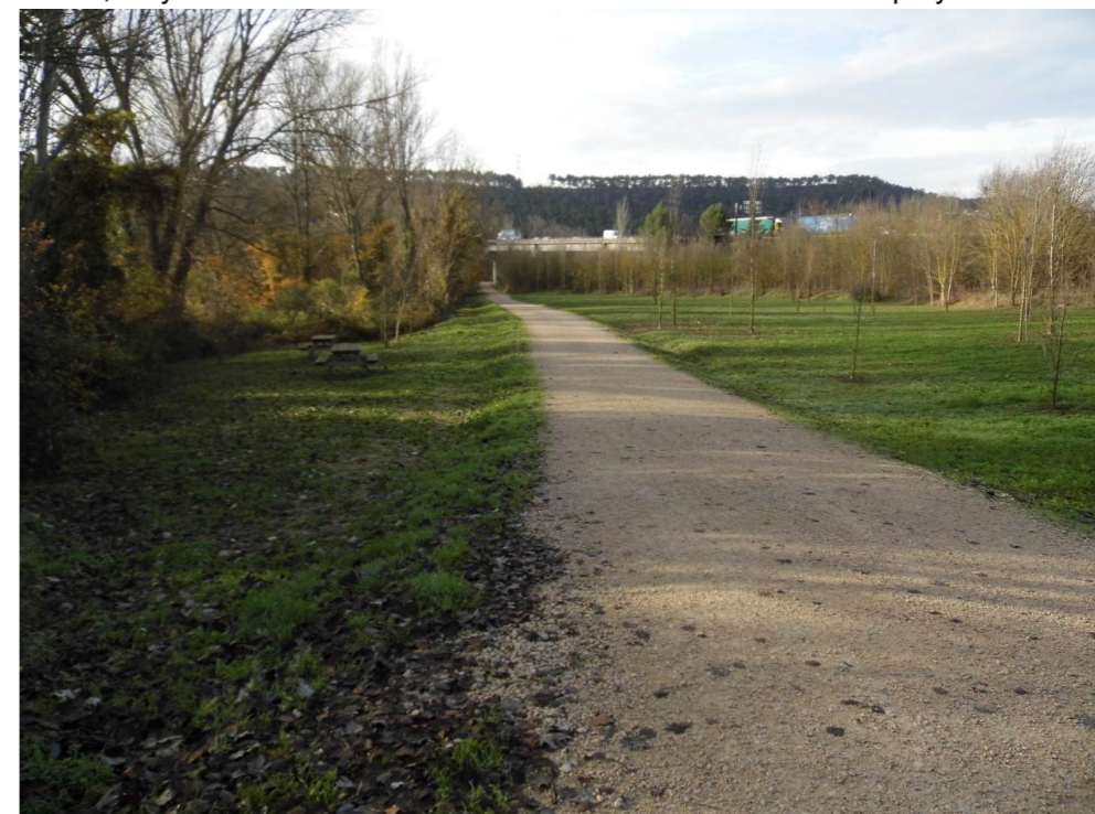
Fotografía 36 Parque Fluvial de la Comarca de Pamplona. Margen derecha del río Arga, en Cendea de Olza, a la altura de la Factoría Volkswagen. Zonas verdes. Zona de viaducto ferroviario proyectado.