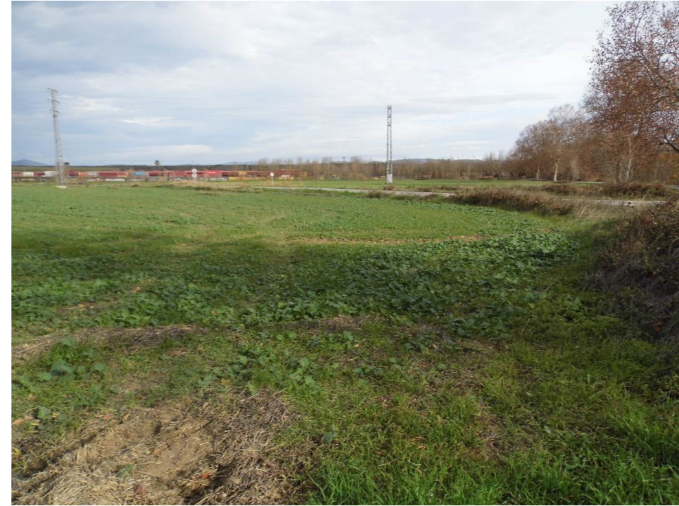
Fotografía 55. Campos de cultivo entre río Elorz y terminal de mercancías de Noáin, atravesados por el trazado de las alternativas de tipo 2.