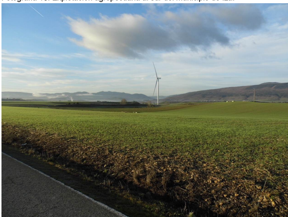
Fotografía 14. Campos de cultivo entre los municipios de Iza y Cendea de Olza. Parque eólico "Orkoien" en el entorno del trazado de la infraestructura ferroviaria.