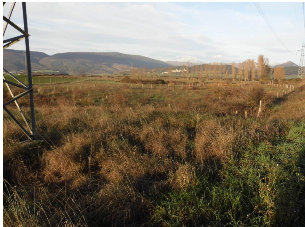
Fotografía 10. Pastizales húmedos y chopera al sur de la localidad de Zuasti, al este del trazado de la infraestructura ferroviaria.