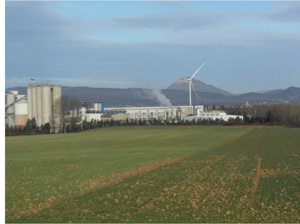
Fotografía 23. Polígono industrial de Ororbía. Campos de cultivo en la vega del río Arga.