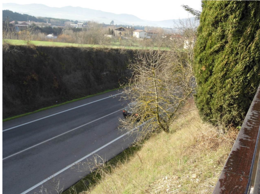
Fotografía 17. Carretera entre Arazuri y Orobia, desde el camino que se dirige a la balsa Ollatibar.