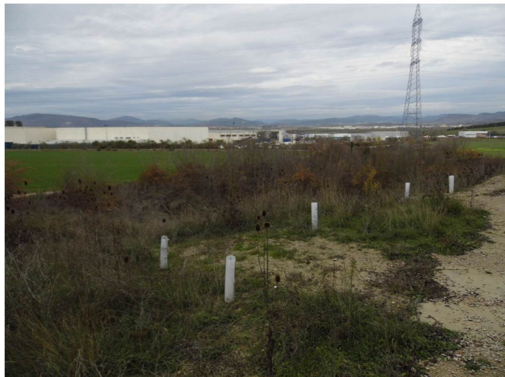
Fotografía 58. Al fondo, Polígono Comarca II, en el término municipal de Galar, desde laderas del barranco Recazar. Zona atravesada por el trazado de las alternativas de tipo 3.