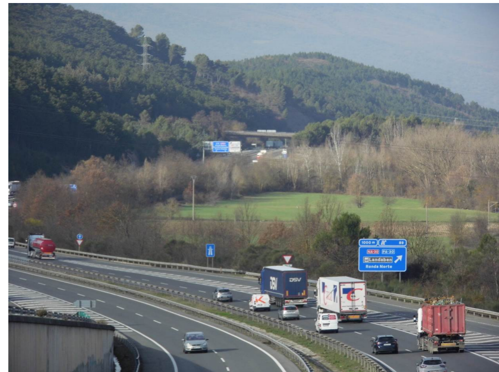
Fotografía 40. Autovía A-15, desde el paso superior de la NA-30. Al fondo, pinares en el límite de los municipios de Cendea de Olza y Cizur Mayor. Zona de viaducto ferroviario proyectado y desmontes en ladera de pinar.