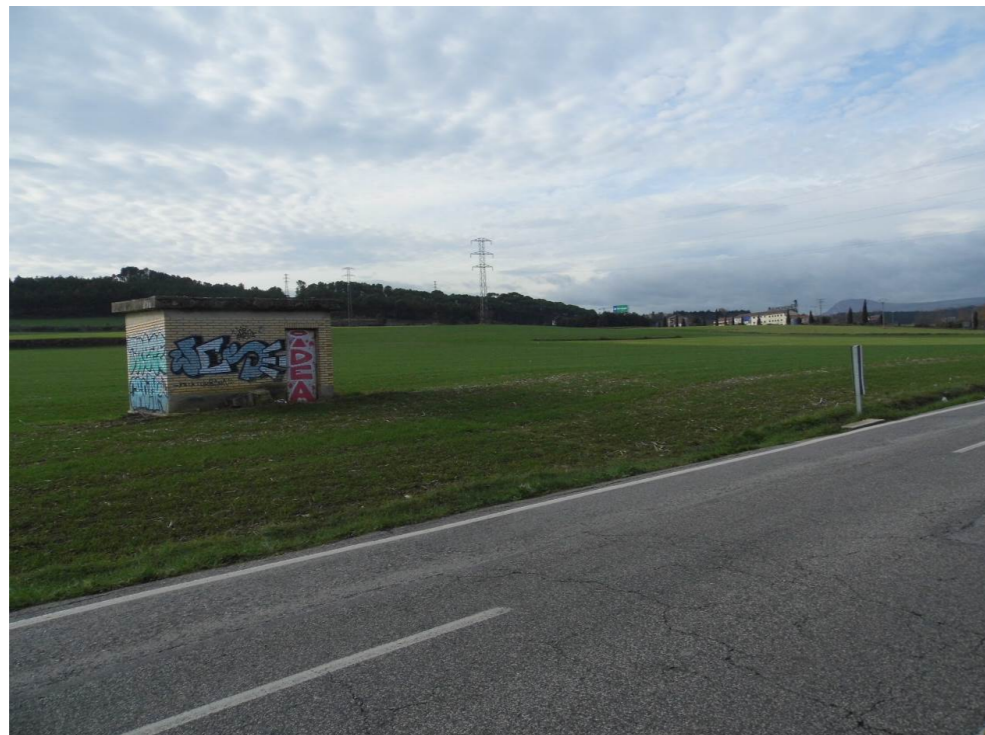
Fotografía 42. Carretera entre avenida de Aróstegui y Colegio Mayor Santa Clara. Límite de los municipios de Pamplona y Cizur. Terrenos correspondientes a la unión de las alternativas de tipo 2 y de tipo 3.