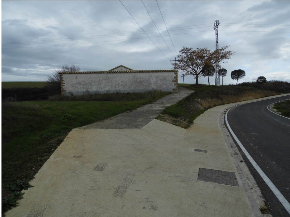
Fotografía 69. Cementerio de Salinas de Pamplona, al sur de la localidad. Proximidades de la zona atravesada por el trazado de las alternativas de tipo 2.