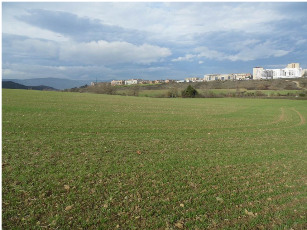
Fotografía 46. Campos de cultivo al norte de la avenida de Aróstegui. Terrenos correspondientes a la nueva estación de Pamplona