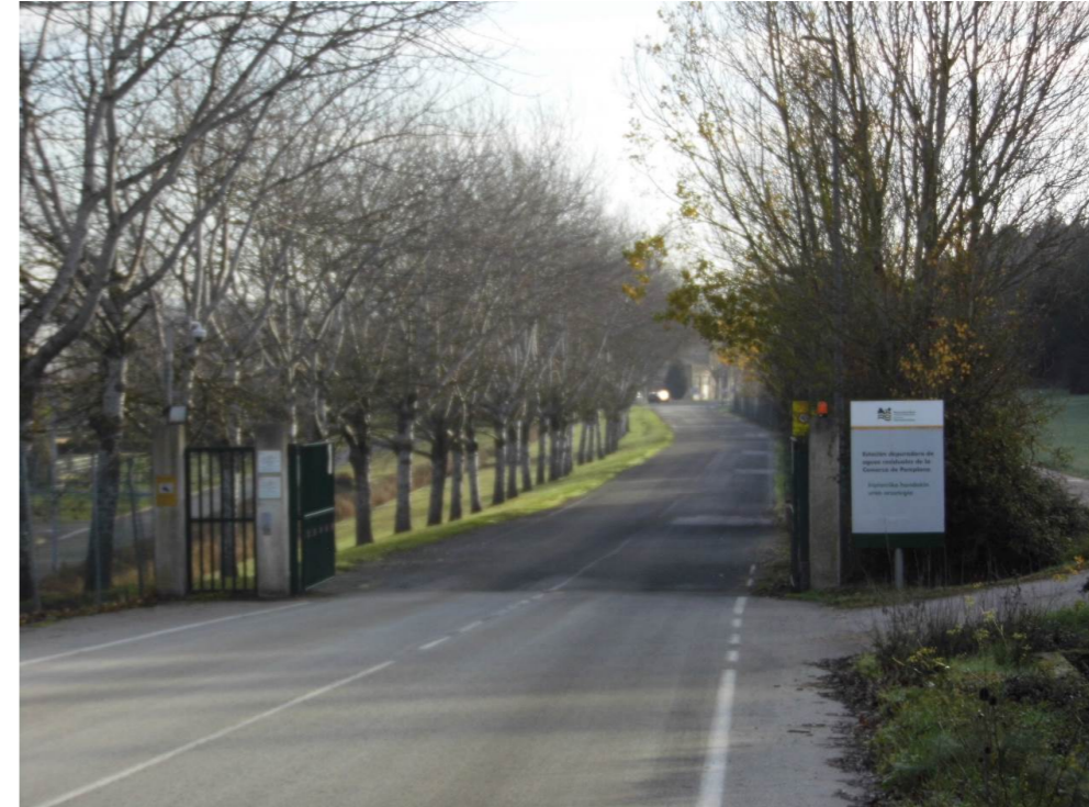
Fotografía 27. Entrada al recinto de la EDAR Arazuri.