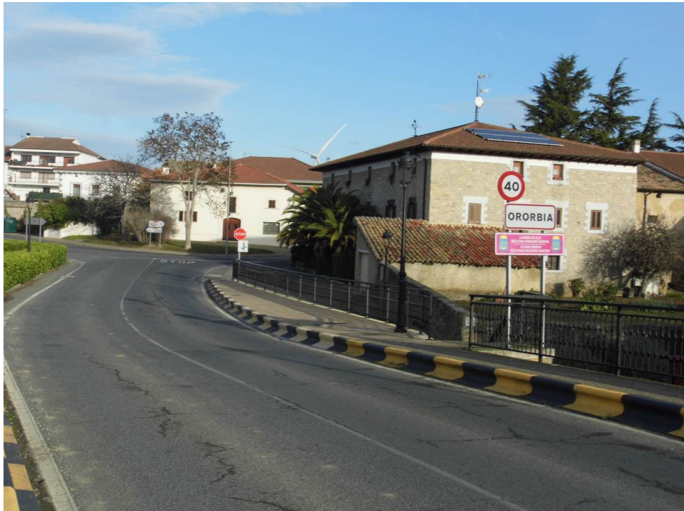
Fotografía 22. Localidad de Ororbía.