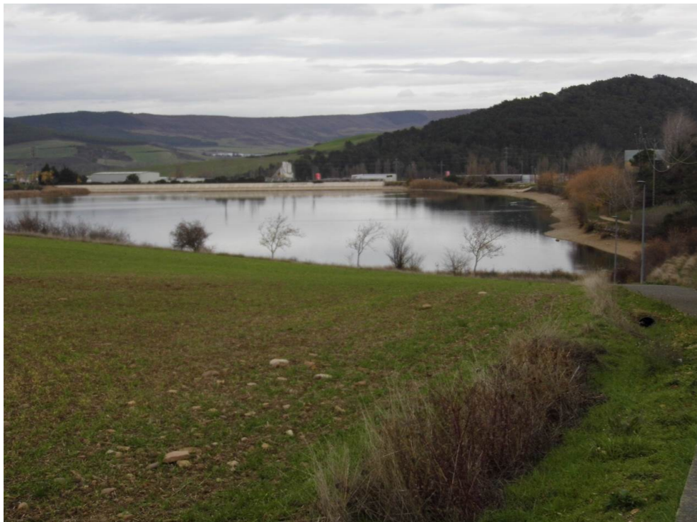
Fotografía 86. Balsa de La Morea, al este de la localidad de Beriáin.