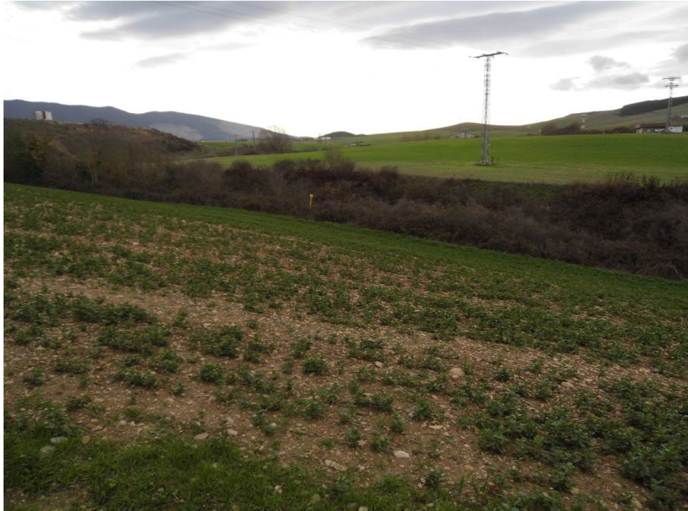
Fotografía 70. Barranco Iturbi, al sur de la localidad de Salinas de Pamplona. Zona atravesada por el trazado de las alternativas de tipo 2.