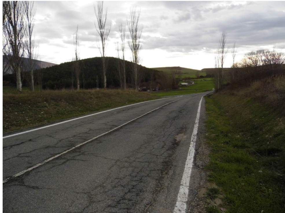
Fotografía 81. Carretera NA-6009, al suroeste de la localidad de Beriáin. Elevación ocupada por pinares situada al suroeste de la localidad (Alto del Monte). Carretera atravesada por las alternativas de tipo 2 y de tipo 3.