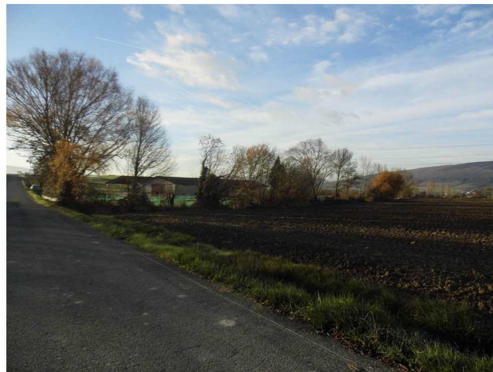
Fotografía 7. Explotación agropecuaria junto a la regata de Zuasti.