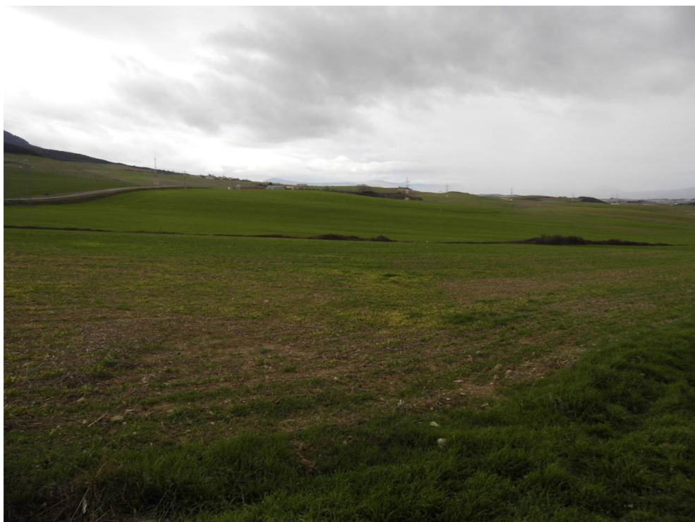
Fotografía 77. Cultivos al norte de la localidad de Beriáin. Zona atravesada por el trazado de las alternativas de tipo 2.