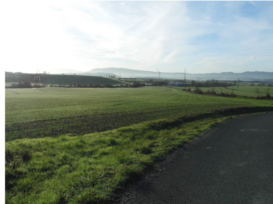
Fotografía 3. Terrenos al sur de Aldaba. Al fondo, regata de Zuasti.