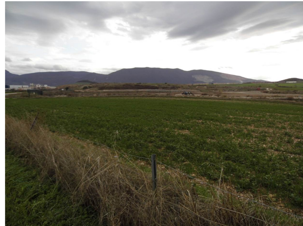
Fotografía 72. Campos de cultivo y áreas degradadas al suroeste del Polígono industrial Meseta de Salinas, en el límite de los municipios de Galar y Noáin. Proximidades de la zona atravesada por el trazado de las alternativas de tipo 2.