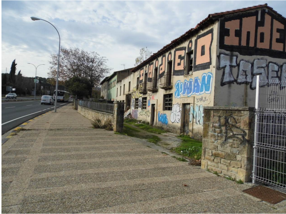
Fotografía 45. Avenida de Aróstegui. Viviendas, algunas en ruinas, afectadas por la infraestructura ferroviaria. Término municipal de Pamplona.