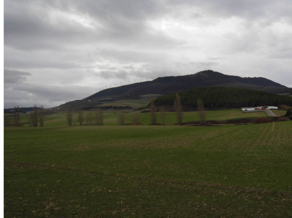
Fotografía 87. Cementerio de Beriáin al pie de elevación ocupada por pinares situada al suroeste de la localidad de Beriáin. Terrenos atravesados por las alternativas de tipo 2.