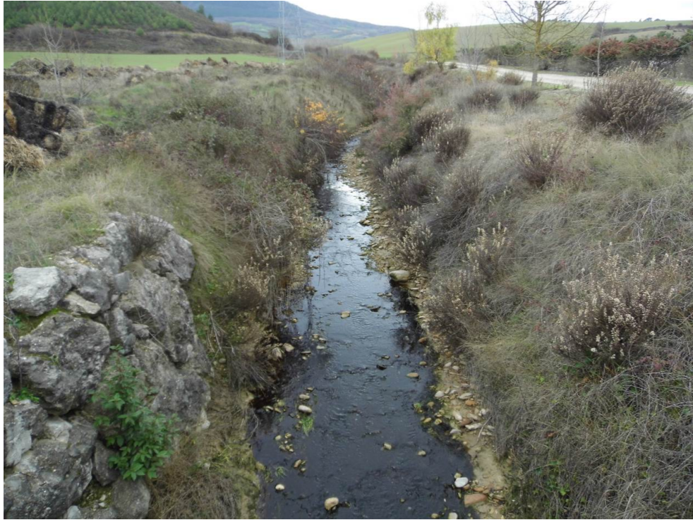
Fotografía 61. Barranco Recazar. Zona atravesada por el trazado de las alternativas de tipo 3.