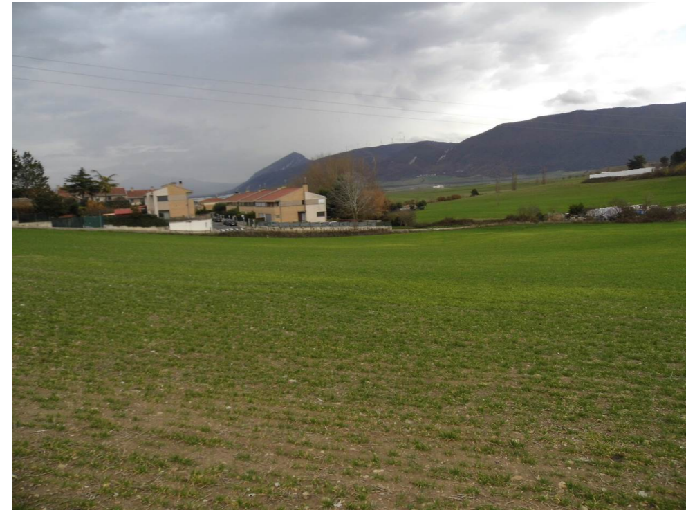
Fotografía 83. Borde suroccidental de la localidad de Beriáin. En primer término, zona atravesada por el trazado de las alternativas de tipo 3.