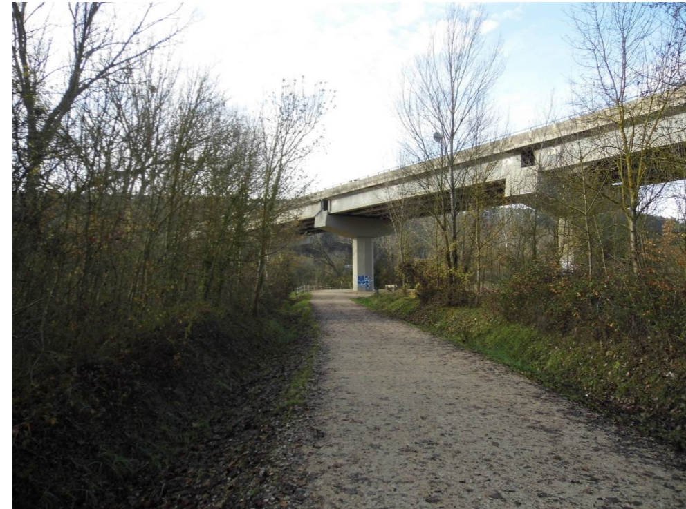
Fotografía 35 Parque Fluvial de la Comarca de Pamplona. Viaducto sobre el río Arga de la carretera NA-30, muy cerca de la autovía A-15. Zona de viaducto ferroviario proyectado.