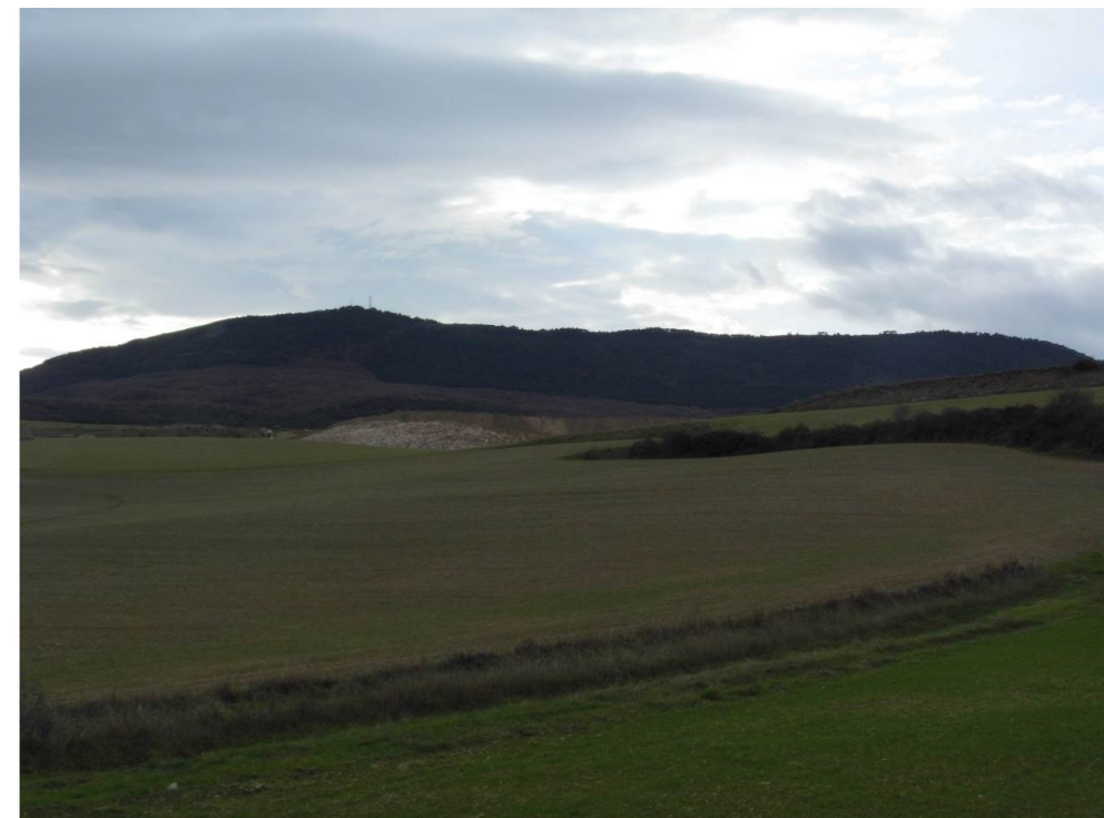
Fotografía 68. Campos de cultivo desde la carretera NA-6008, entre Salinas de Pamplona y Esparza. Al fondo, explotación minera Las Arrubias. Zona atravesada por el trazado de las alternativas de tipo 3.