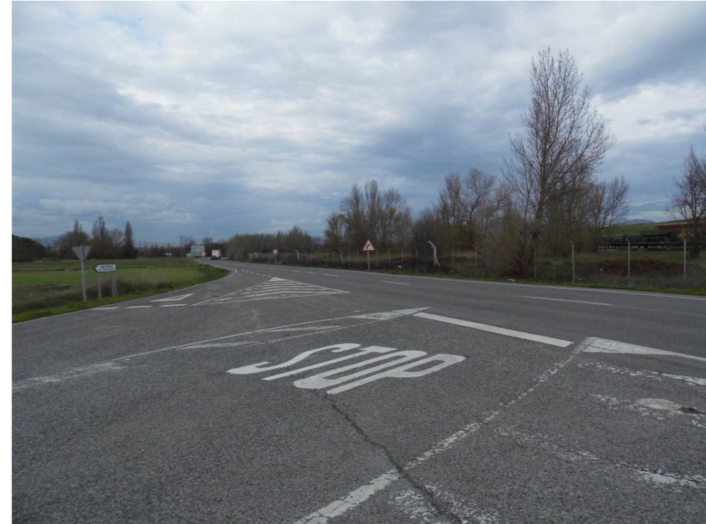
Fotografía 56. Carretera de Esquiroz, NA-6001, junto al recinto de la terminal de mercancías de Noáin. Zona atravesada por el trazado de las alternativas de tipo 2.