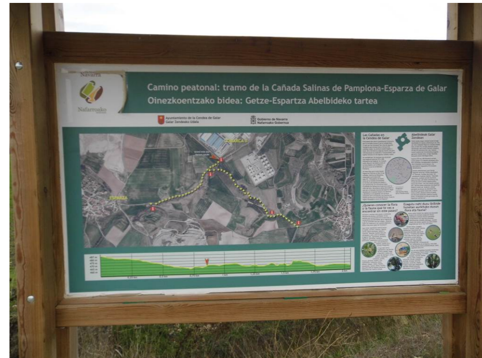
Fotografía 64. Cartel informativo en el Barranco Recazar. Zona atravesada por el trazado de las alternativas de tipo 3.