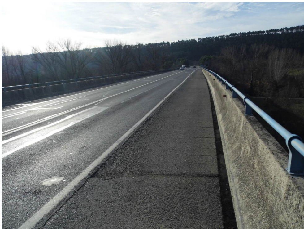
Fotografía 38. Viaducto sobre el río Arga de la carretera NA-30 en su unión con la autovía A-15. Zona de viaducto ferroviario proyectado.