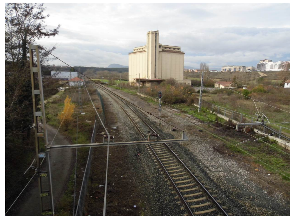
Fotografía 44. Paso superior sobre el ferrocarril en la avenida de Aróstegui. Vista hacia el oeste.