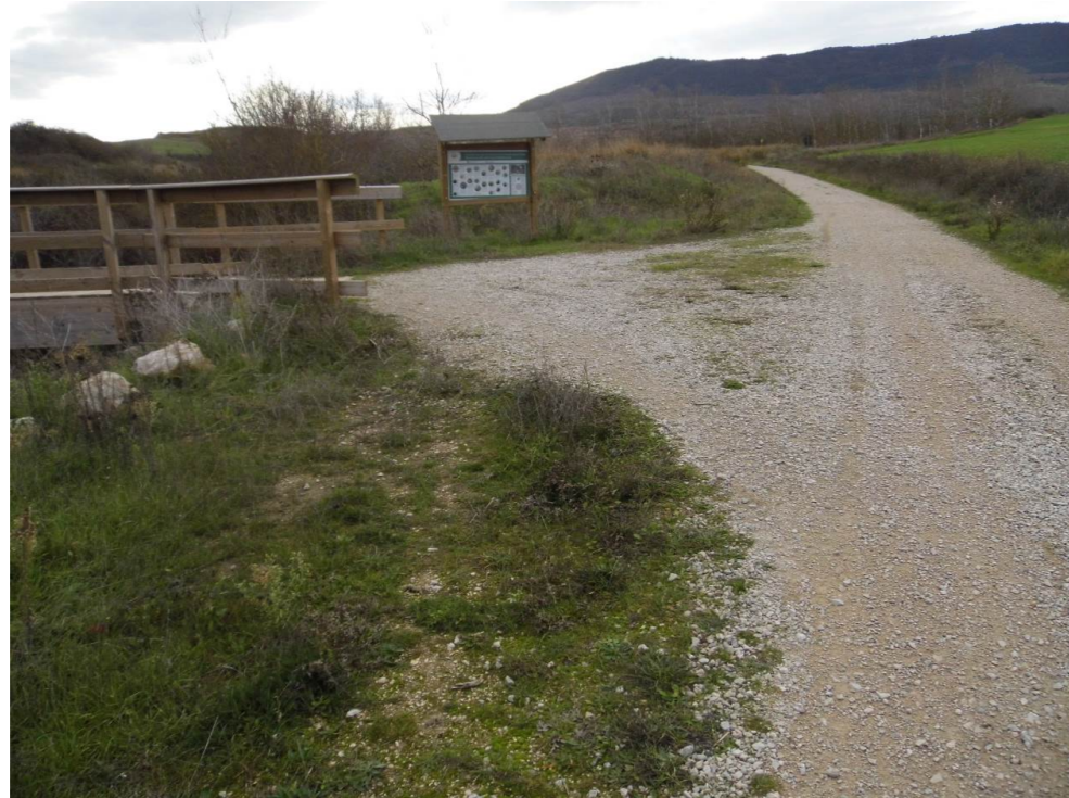
Fotografía 65. Barranco Recazar. Camino peatonal señalizado. Tramo de la Cañada Salinas de Pamplona-Esparza de Galar. Puente sobre el barranco. Zona atravesada por el trazado de las alternativas de tipo 3.