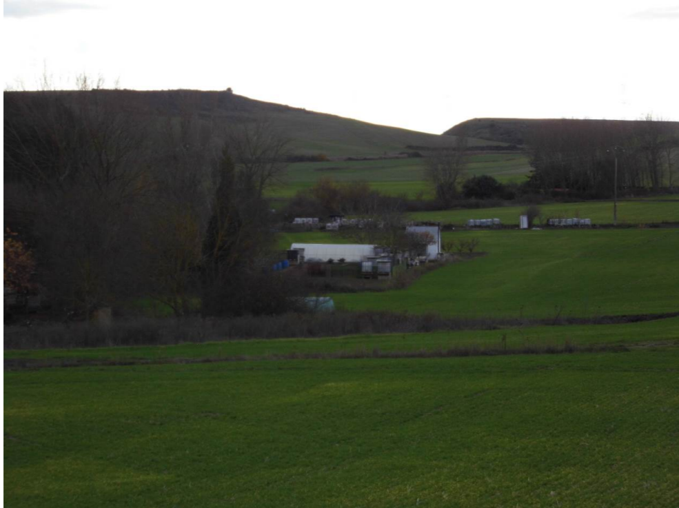
Fotografía 85. Huertos y pequeñas construcciones al noroeste de la elevación ocupada por pinares situada al suroeste de la localidad de Beriáin (Alto del Monte). Terrenos atravesados por las alternativas de tipo 2.