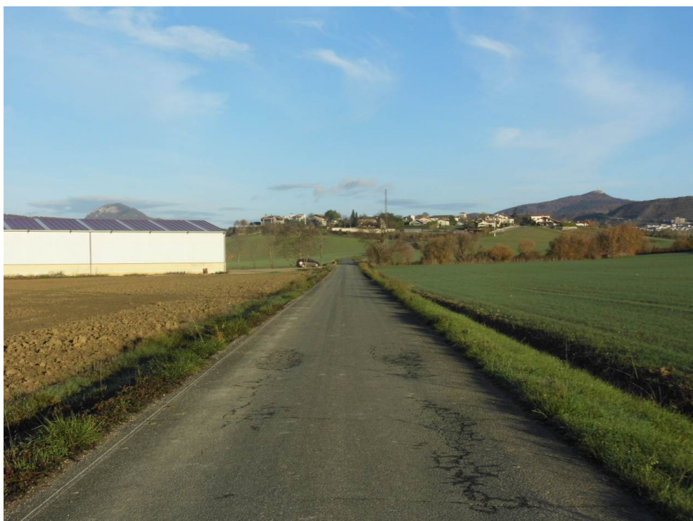
Fotografía 6. Núcleo de Aldaba y explotación agropecuaria desde el sur de la localidad.