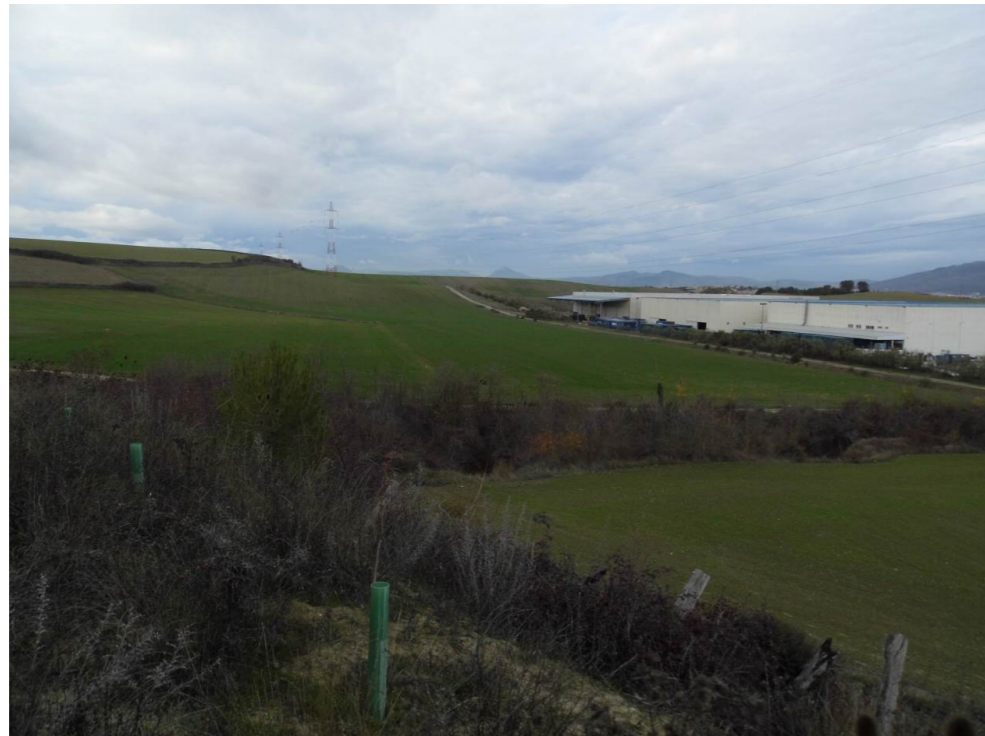
Fotografía 66. Parcelas de cultivo situadas al oeste del Polígono Comarca II, en el término municipal de Galar, desde laderas del barranco Recazar. Zona atravesada por el trazado de las alternativas de tipo 3.