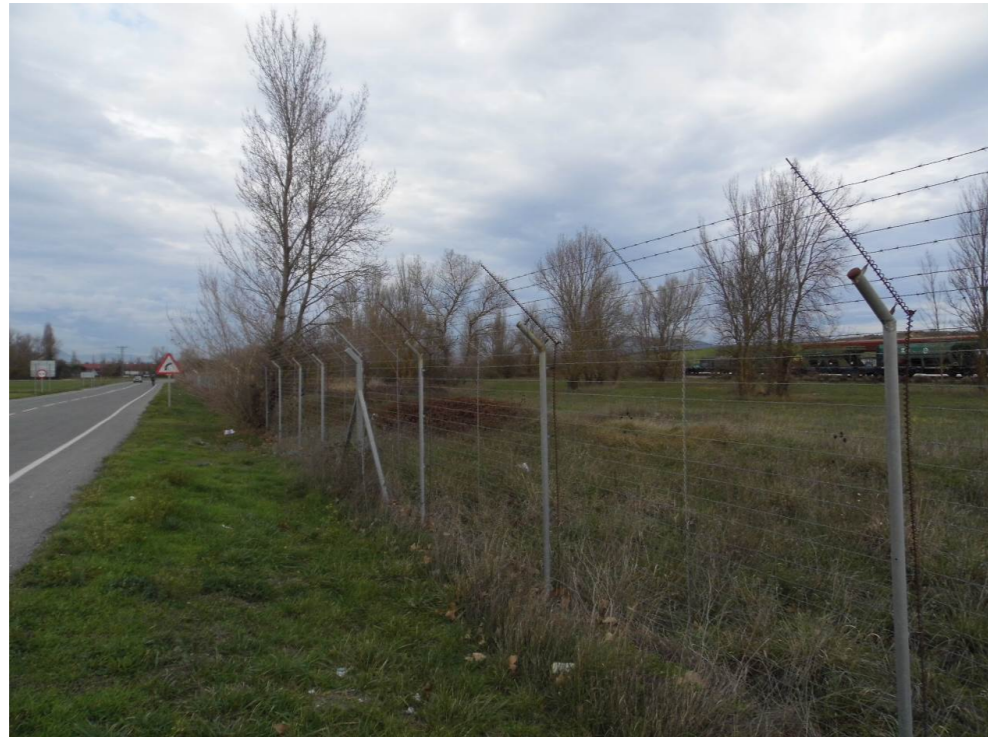
Fotografía 57. Recinto de la terminal de mercancías de Noáin, junto a la carretera de Esquiroz, NA-6001. Zona atravesada por el trazado de las alternativas de tipo 2.