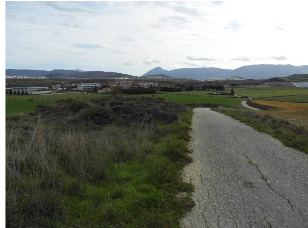
Fotografía 51. Camino de Esquiroz, desde Cizur. Al fondo, Esquiroz. Zona atravesada por el trazado de las alternativas de tipo 3.