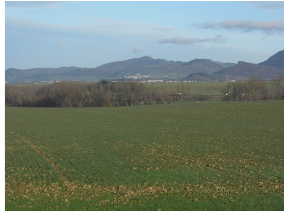
Fotografía 24. Vega en el entorno de la confluencia del río Arga y el río Juslapeña en la zona atravesada por el trazado de la infraestructura ferroviaria.