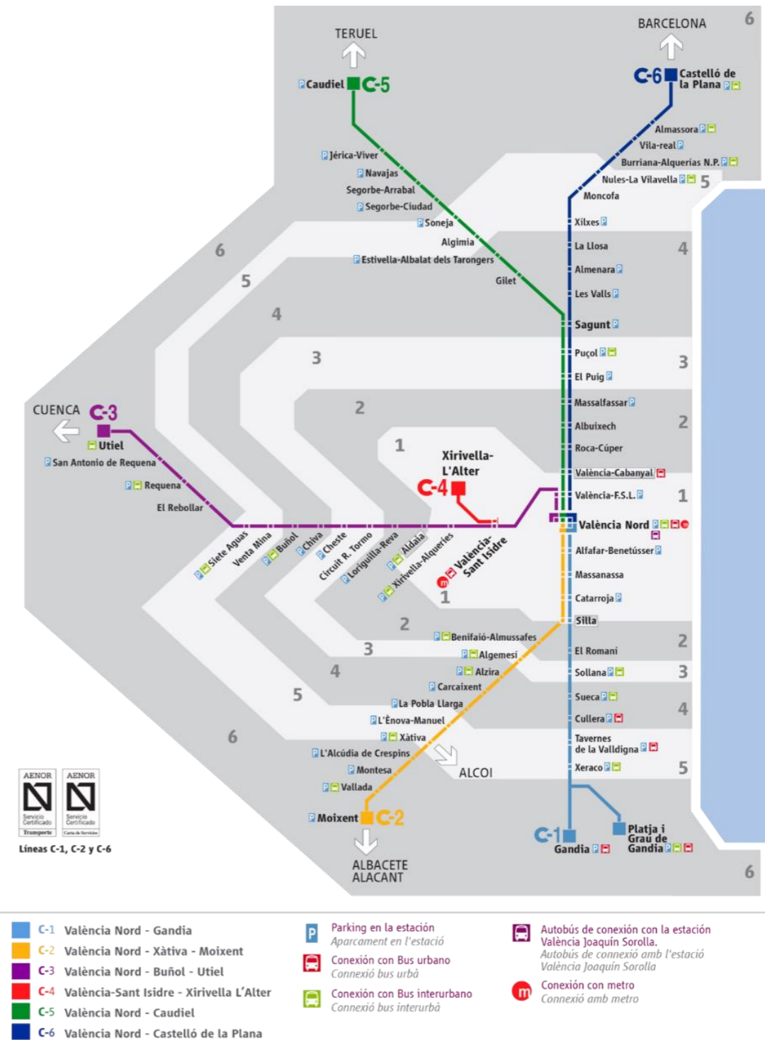
Figura 2: Red de Cercanías RENFE de Valencia.