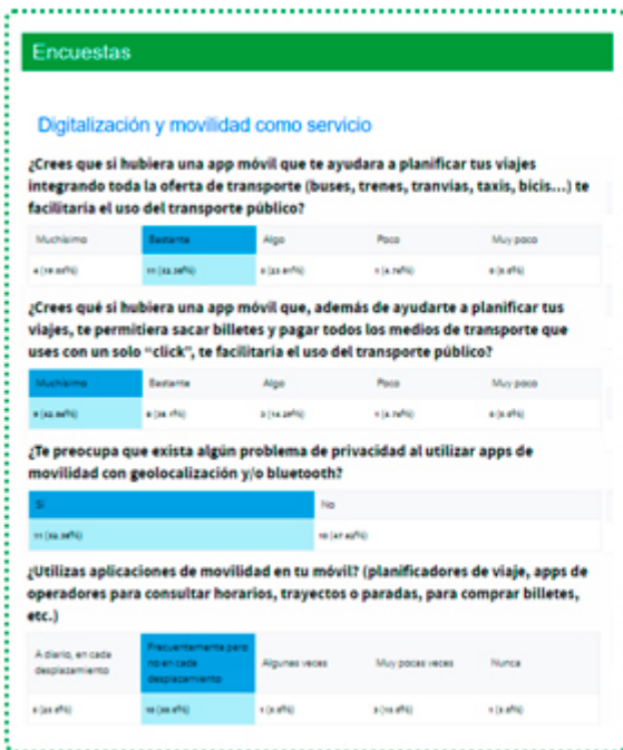
Resultado de la encuesta del Diálogo Abierto de Movilidad publicado en enero de 2021