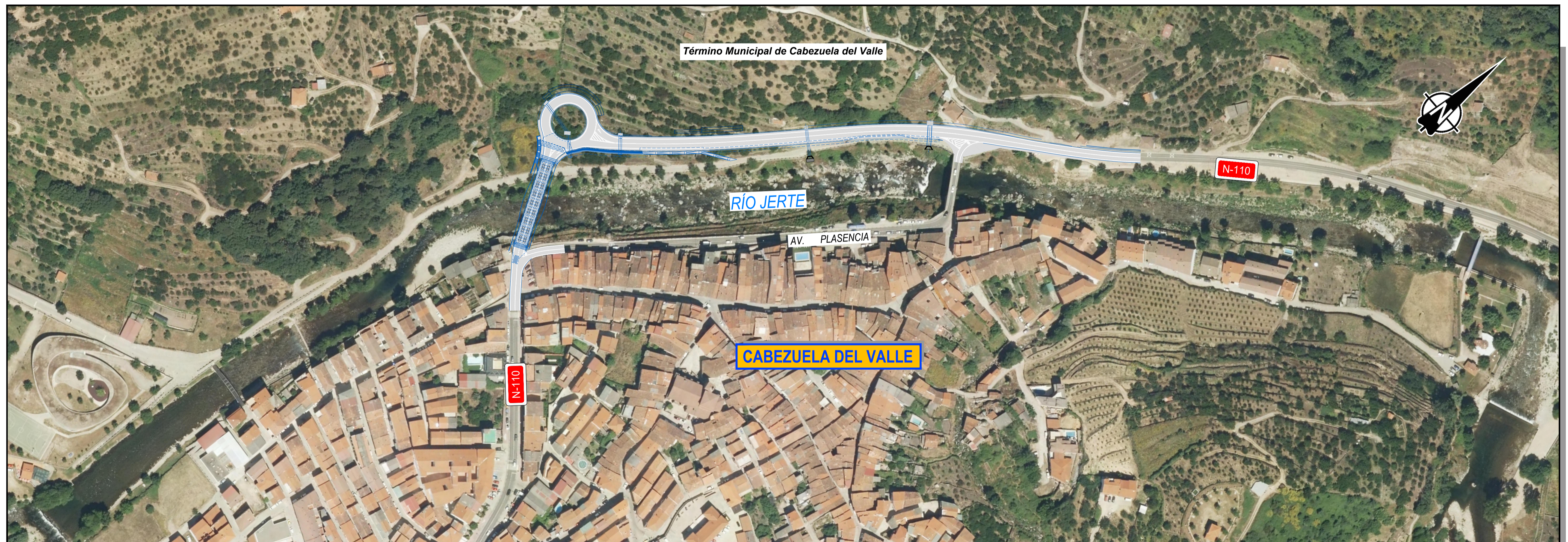
PLANO DE SITUACIÓN ESCALA 1:1.500

C:\Users\pc001\AppData\Local\Temp\AcPublish_5060\2_PLANO DE SITUACIÓN.dwg