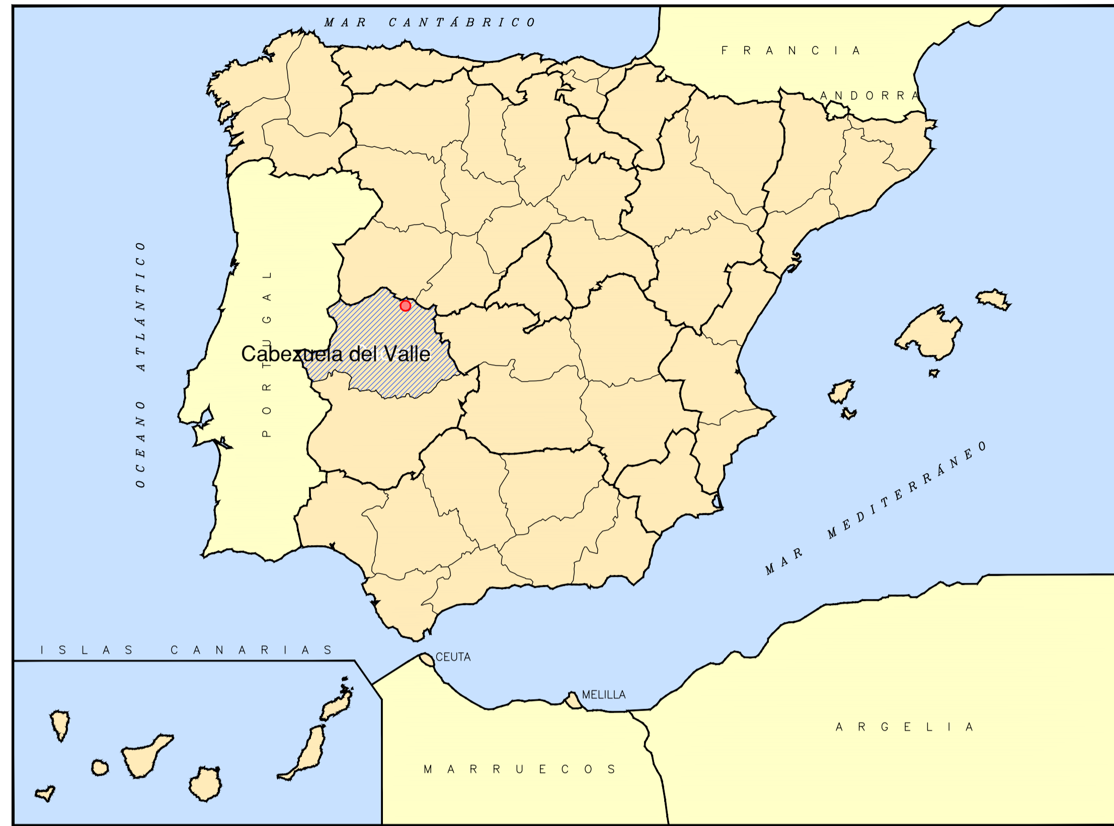
SITUACIÓN GEOGRÁFICA SIN ESCALA