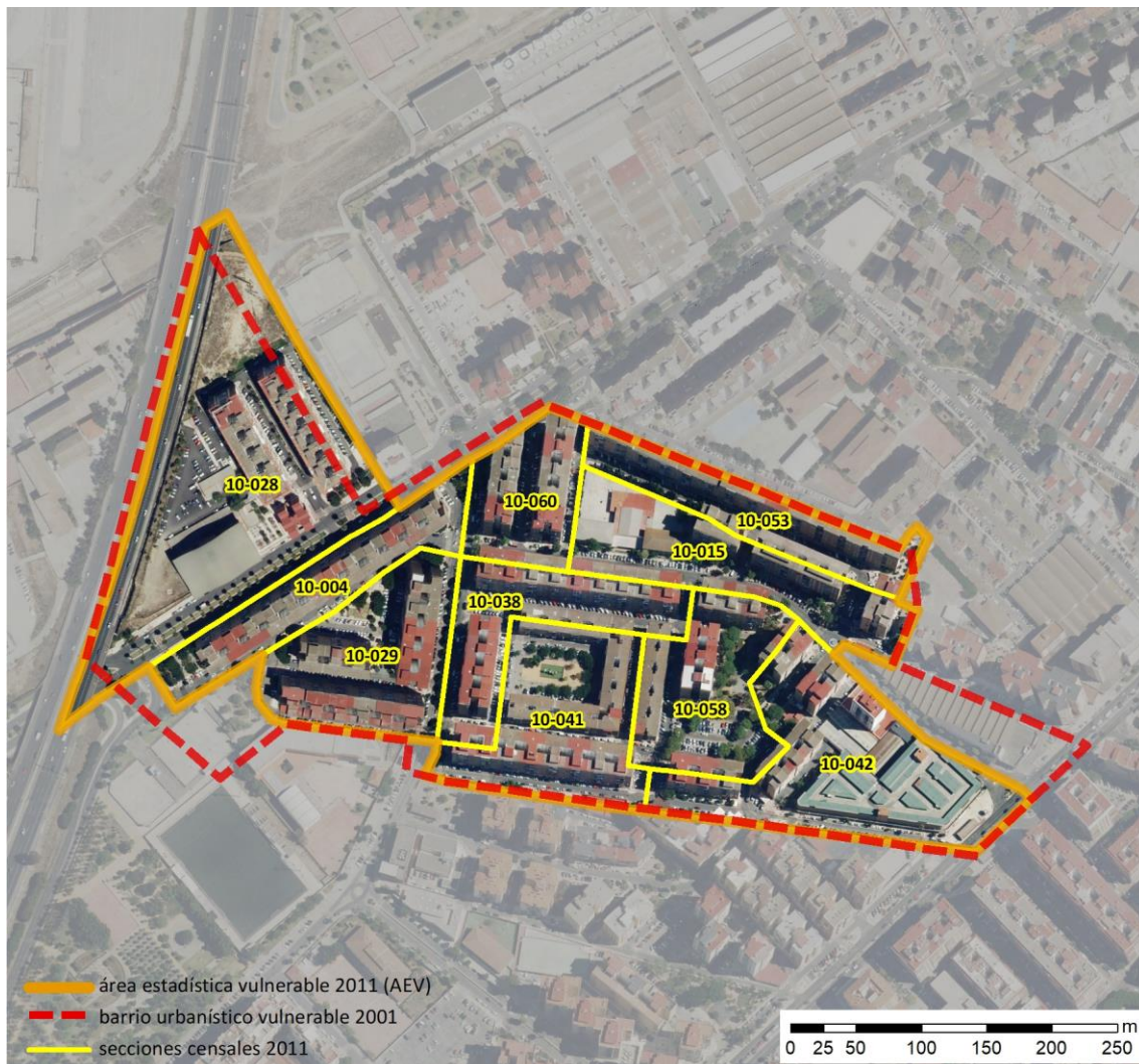
Localización en detalle del AEV