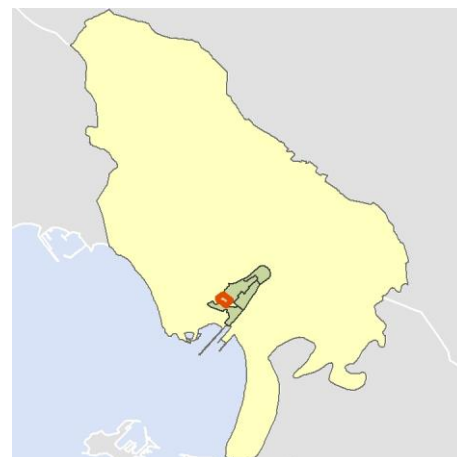
Localización del AEV dentro del término municipal