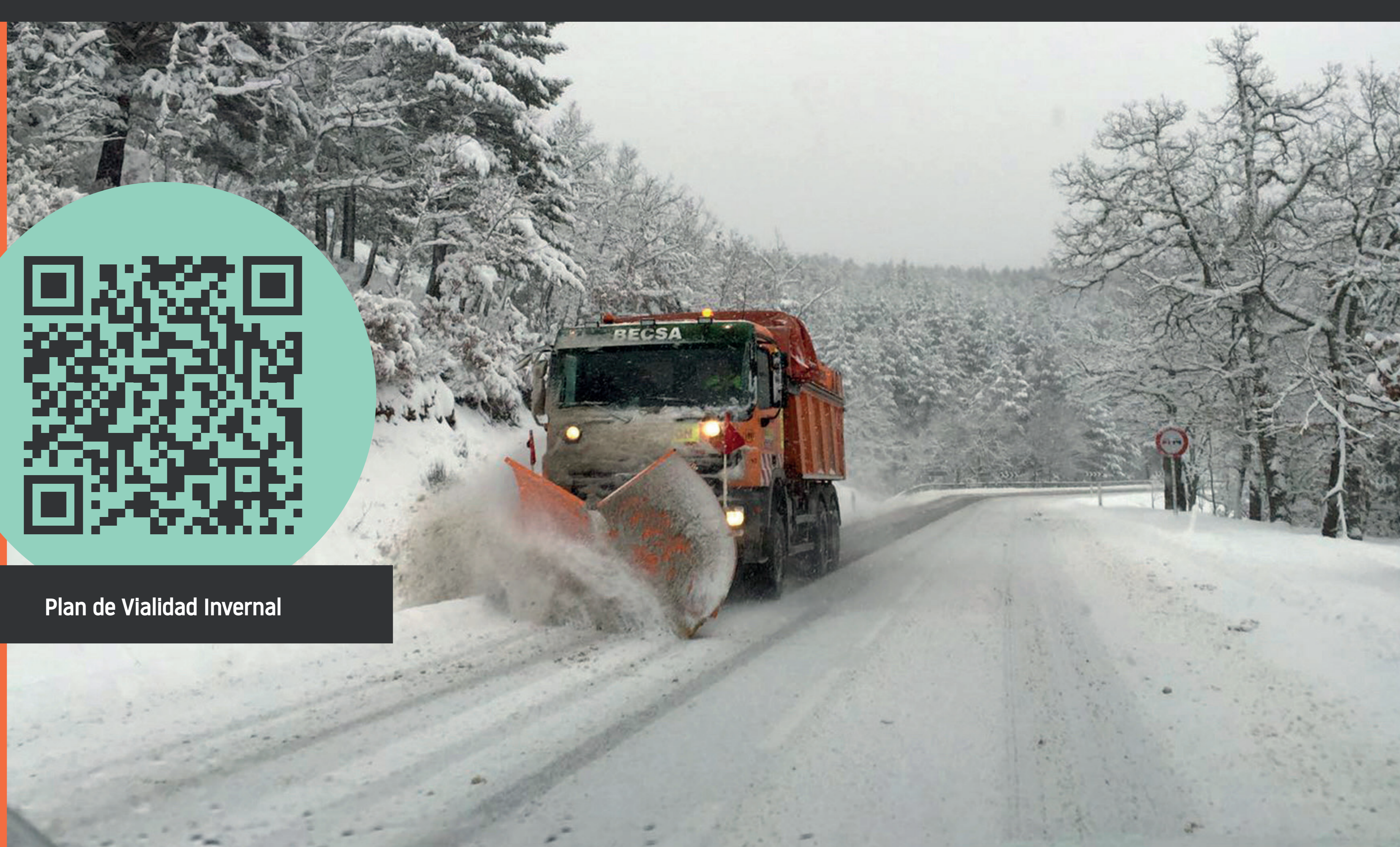
Plan de Vialidad Invernal

Average annual investment in maintenance of more than €1,070 million. Winter Road Safety Plan with 1,470 snow ploughs and more than 250,000 tonnes of snow melt per year. Road safety inspections using high-performance technology.