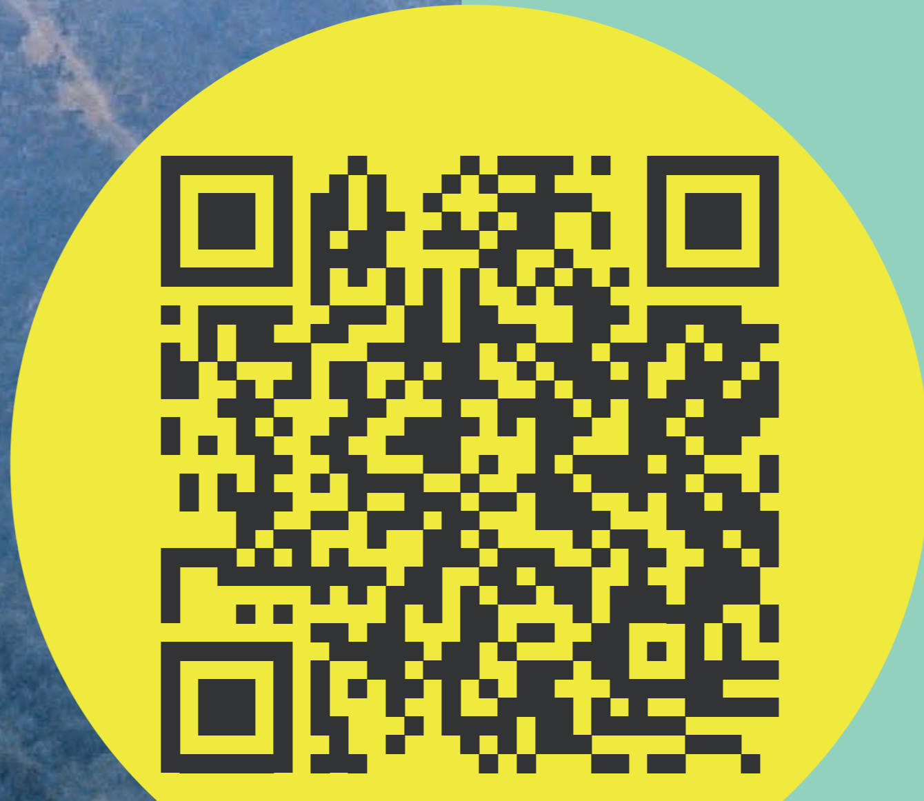
Nuevos tramos en servicio