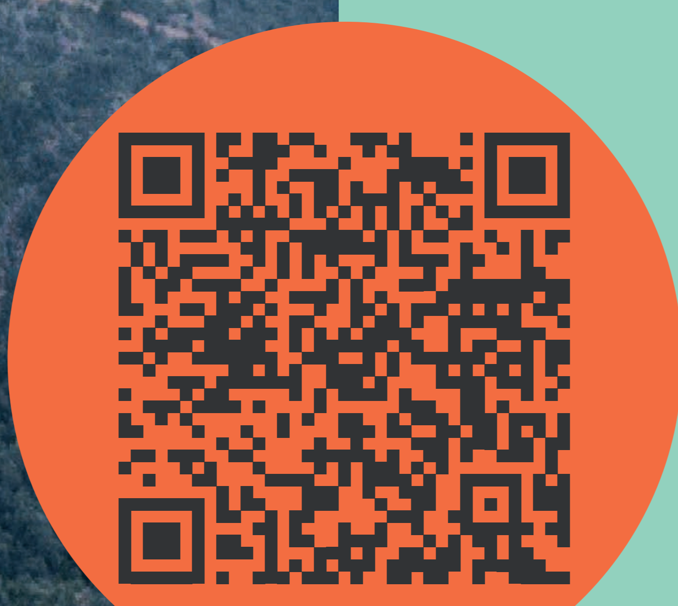
Principales obras en ejecución