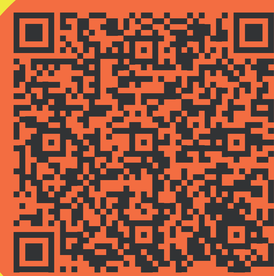
Plan de Recuperación, Transformación y Resiliencia